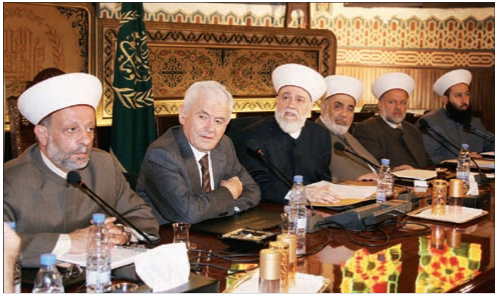
المفتي الشيخ د.محمد رشيد قباني مترئسا المجلس الإسلامي الشرعي الأعلى (محمود الطويل)

من جهتها، قالت صحيفة «المستقبل» ان حزب الله شكل لجنة من الحقوقيين مهمتها إجراء قراءة دقيقة للبروتوكول الموقع بين لبنان والمحكمة الدولية، والانصراف في ضوءها الى إعداد لأئحة التعديلات المفترض إدخالها عليه لتطوير