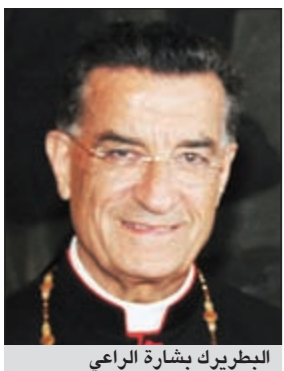
البطريرك بشاره الراعي