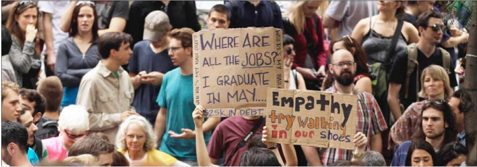
جانبا من التظاهرات التي تخلها أكثر من ألفي شخص في نيويورك

ذكر تقرير شركة بيان للاستثمار أن سوق الكويت للأوراق المالية أنهى تداولات الأسبوع الأخير من فترة الربع الثالث من العام الحالي مسجلاً انخفاضاً ملحوظاً لمؤشره الرئيسي وسط أداء يومي اتسم بالتذبذب. وقال تقرير «بيان للاستثمار» ان الضغوط البيعية سيطرت على مجريات التداول في السوق خصوصاً في ظل استمرار حضور العوامل السلبية وغياب المحفزات الايجابية، وجاءت خسائر السوق في الوقت الذي تشهد فيه الكويت حراكاً سياسياً. وأوضح التقرير ان السوق لم يتمكن من عكس اتجاهه الهابط للأسبوع الثاني على التوالي في ظل استمرار موجة البيع التي شملت العديد من الأسهم في معظم القطاعات والمضاربات السريعة التي ينفذها بعض المتداولين على عدد من الأسهم في قطاعي الاستثمار العقار ما أدى إلى ظهور تذبذبات محدودة لمؤشر السوق. وأشار إلى أن السوق تمكن من تحقيق بعض الارتفاعات مدفوعاً من عدد من الأسهم القيادية رغم التراجع في معظم جلسات الأسبوع. ولم تفلح تداولات اللحظات الأخيرة التي شهدتها أغلب الجلسات اليومية واتسمت بعمليات الشراء الانتقائية في تحويل المسار للمنطقة الخضراء وتمكنت من تقليص خسائر مؤشره فقط.