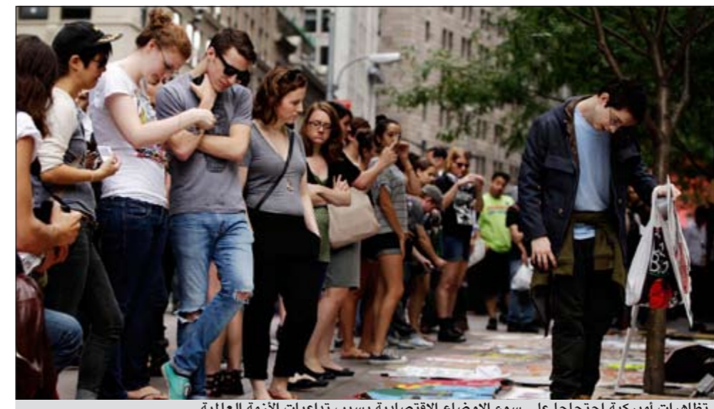
تظاهرات أميركية احتجاجاً على سوء الأوضاع الاقتصادية بسبب تداعيات الأزمة العالمية

خطته البالغة قيمتها 447 مليار دولار لتوفير فرص عمل قائلًا إن «الوقت حان لكي يعيد الكونغرس ترتيب أولوياته». ويقول أوباما الذي تلقى البطالة المرتفعة والاقتصاد البطيء بظلال من الشك على فرص إعادة انتخابه في 2012 ان مشروع قانون الوظائف الذي قدمه ينبغي أن يمول بالأساس عن طريق إنهاء إعفاءات ضريبية للشركات وتقييد الإعفاءات المنحوتة للأغنياء، ويعارض الجمهوريون تلك الأفكار ومعهم بعض زملاء أوباما في الحزب الديموقراطي. لكن الزعماء الجمهوريين