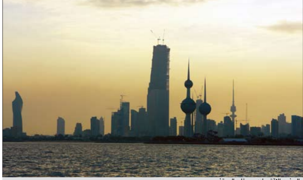
الوضع الاقتصادي يحتاج إلى تغيير سريع

المناسب لقرار تغيير الحكومة - نهجا وشخصا - خلال الأسابيع الثلاثة المقبلة، ونعتقد أن القرار في توقيتته المناسب مزايا جوهرية عديدة أولاها اجتذاب معركة غاضبة لثمة قد تمتد إلى الشارع ونأنيتها تغيير إيجابي للمناخ القاتم وغير المسبوق على مستوى الرأي العام وثالثها أن التغيير مستحق بسبب سوء الأداء بغض النظر عن أولا وثانيا ورابعها هو وقف التزيف والهدر اللذين لا يمكن تعويضهما من سيل المطالبات بالكوارث والتهديد بالإضرابات وخامسها أن قيمة