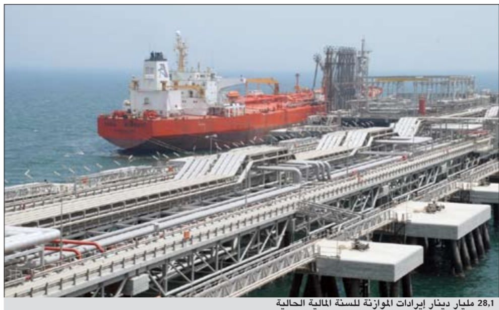
28,1 مليار دينار إيرادات الموازنة للسنة المالية الحالية

حققت الكويت إيرادات نفطية فعلية خلال الشهرين الأولين من السنة المالية الحالية 2011/2012 بما قيمته 4,451 مليار دينار، ويفترض أن تكون الكويت قد حققت إيرادات نفطية خلال النصف الأول بما قيمته 13,5 مليار دينار، وإذا افترضنا استمرار مستوي الإنتاج والأسعار على حالهما - وهو افتراض في جانب الأسعار على الأقل لا علاقة له بالواقع - فإنه من المتوقع بلوغ قيمة الإيرادات النفطية المحتملة للسنة المالية الحالية بمجموعها نحو 27 مليار دينار، وهي قيمة أعلى بنحو 14,7 مليار دينار، عن تلك المقدرة في الموازنة. ومع إضافة نحو 1,1 مليار دينار، إيرادات غير نفطية ستبلغ جملة إيرادات الموازنة للسنة المالية الحالية نحو 28,1 مليار دينار. وبمقارنة هذا الرقم باعتمادات المصروفات البالغة نحو 19,435 مليار دينار، ستكون النتيجة تحقيق فائض افتراضي في الموازنة يقارب 8,7 مليارات دينار، لجمال السنة المالية 2012/2011.