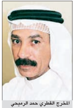
المخرج القطري حمد الرميحي

عبر المخرج القطري القدير حمد الرميحي عن سعادته لمشاركته في مهرجان أيام المسرح للشباب الثامن الذي تنظمه الهيئة العامة للشباب والرياضة من 9 الجاري وحتى 22 من الشهر نفسه وذلك من خلال مسرحية «الطبل والطار» والتي ستقدم على خشبة مسرح كيفان كعرض خارج المنافسة والتي يتصدى لإخراجها ويجسد شخصها فرقة الشباب القطري. وأضاف في تصريح صحافي خص به المركز الإعلامي في المهرجان، أن مشاركته في هذه