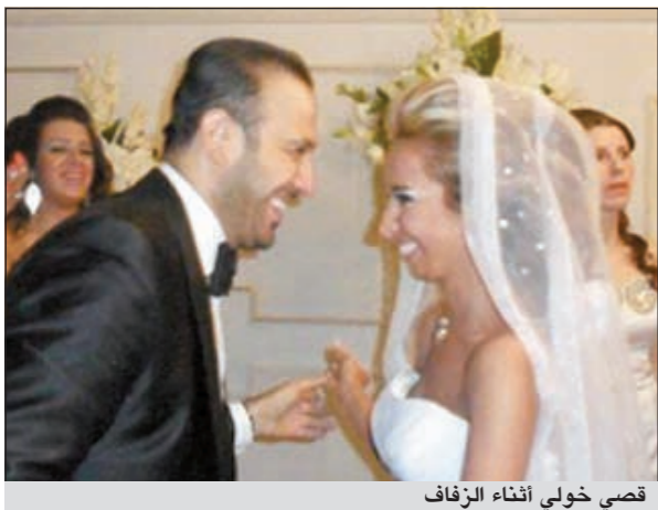
قصي خولي أثناء الزفاف

لشائعة مماثلة أيضا قبل أسابيع. إذ تناقلت بعض وسائل الإعلام نبئته إعلان خطوبته رسميا من كندة حنا، وهذا ما نفاه الممثلان في وقت سابق.