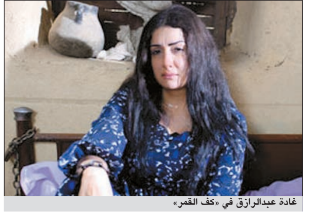
غادة عبدالرازق في «كف القمر»

لديها 5 أولاد، تحاول طوال أحداث الفيلم إحتواءهم والسعي وراء حل مشكلاتهم، إلى أن تضطر بعد تفاقم هذه المشاكل إلى ترك المنزل. ووفاء عامر وحسن الرداد وهيثم أحمد زكي وصبري فواز. ويجسد خالد صالح شخصية «ذكرى»، الذي يعمل في بداية حياته في المقاولات، ثم يتجه لتجارة السلاح، أما حسن الرداد فيجسد شخصية بائع عصير. وتدور أحداث الفيلم تدور حول أم (وفاة عامر)