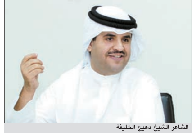
الشاعر الشيخ دعيخ الخليفة

سيغادر الكويت ضمن الوفد المشارك منتصف هذا الأسبوع وسيظل في مدينة ميلانو حتى ختام الأنشطة من أجل متابعة الأمور عن كسب، حيث يتوقع أن يحضر هذه الأيام