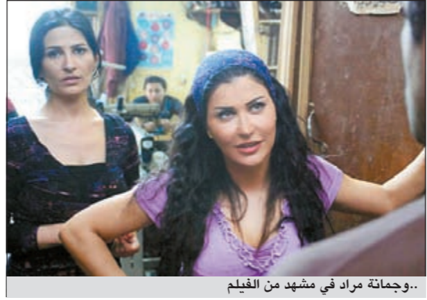
..وجماعة مراد في مشهد من الفيلم