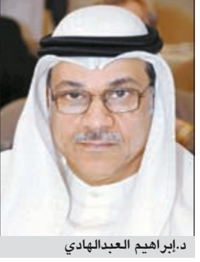
د. إبراهيم العبدالهادي

تأكيداً لما نشرته «الأنباء» في عددها أمس عن قيام وزارة الصحة برفع كوادرها ليدوان الخدمة المدنية، كشف وكيل وزارة الصحة د. إبراهيم العبدالهادي أنه تم رفع كوادر الإدرابين والفينين إلى ديوان الخدمة المدنية لدراستها تمهيداً لإقرارها، مشيراً إلى أن وزارة الصحة تتابع عن كثب هذا الموضوع مع الديوان إلى حين إقرار هذه الكوادر، مشيراً إلى أن الوزارة لا تؤيد الإضرابات التي تعتبر اهانة للمهن الطبية لأنها تقدم خدمة إنسانية للمرضى، مشيراً إلى أنه في حال حدوث الإضراب سنسد النقص الحاصل.