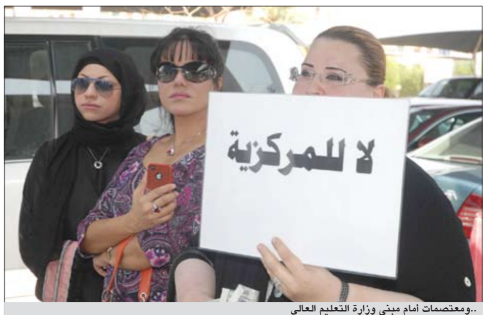
معتصمات أمام مبنى وزارة التعليم العالي