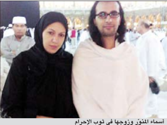
أسماء المنور وزوجها في ثوب الإحرام

على رغم الحياة المأوى بالحفلات والسفر التي يعيشها الفنانين، وحرصهم الدائم على الظهور بأكمل أنانيتهم وبإياهم حلقة، إلا أن هناك أيضاً الكثير من لحظات الصفاء والبعد عن مظاهر النجومية والشهرة حيث يكون المشاهير على طبيعتهم بعدما خلعوا ثوب الفن والأضواء، وتحولوا إلى أشخاص عاديين. وخير مثال على ذلك صورة تجمع الفنانة المغربية أسماء المنور وزوجها الملحن التونسي عصام الشرابطي. وقد التقطت الصورة، بحسب موقع «أنا زهرة» عندما كان الاثنان يؤديان فريضة العمرة في مكة المكرمة. وظهرت أسماء وقد ارتدت جلباباً أسود، ووضعت الحجاب فيما ارتدى زوجها ثوب الإحرام في لحظة تقرب من الله خالية من أي مظاهر دنيوية.