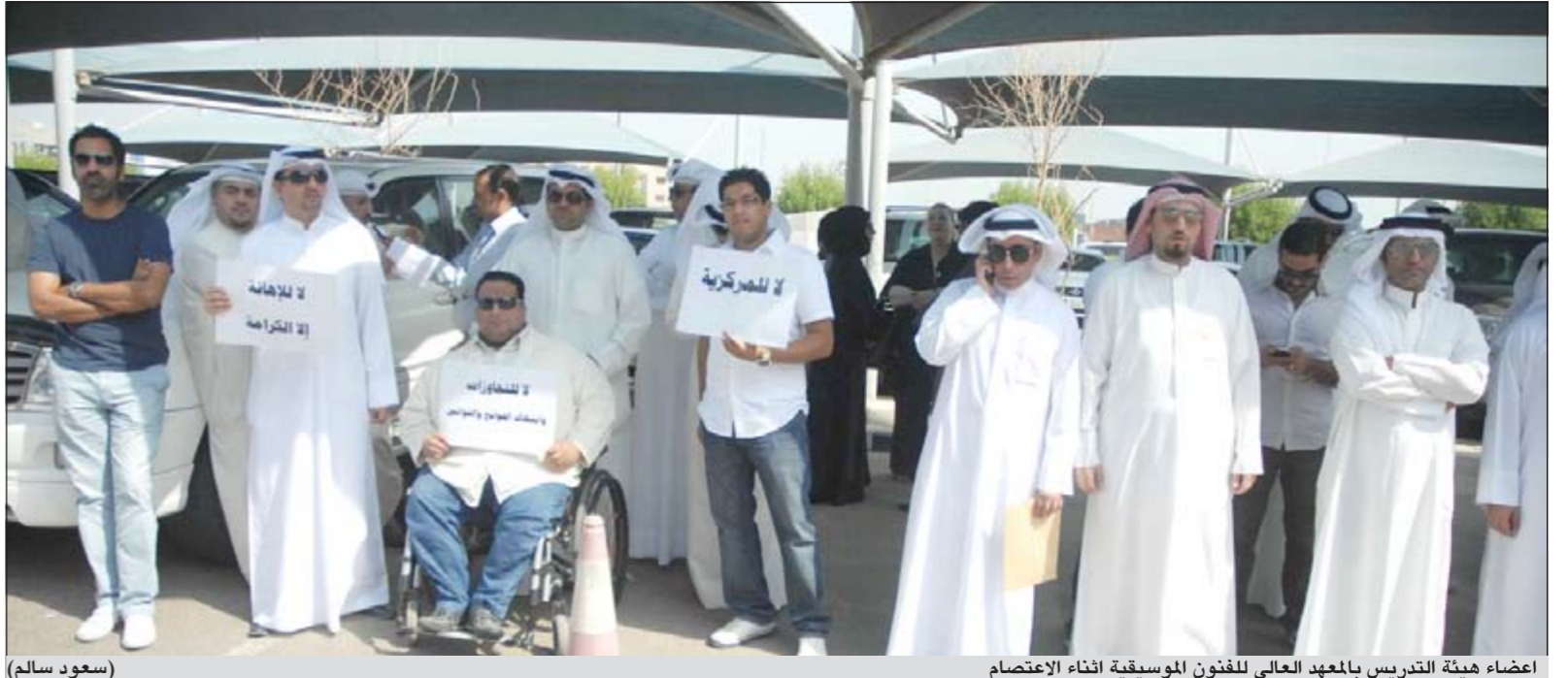
أعضاء هيئة التدريس بالمعهد العالي للفنون الموسيقية أثناء الاعتصام

وافقت الفنانة علا غانم على بطولة المسلسل الجديد «النار والطين» الذي تنتجه شركة صوت القاهرة، والمقرر عرضه في موسم رمضان 2012. كل من محافظتي قنا وأسيوط خلال الأسبوعين المقبلين، من أجل معاينة أماكن التصوير الخارجية هناك، حيث أن المسلسل تدور معظم أحداثه في صعيد مصر، لبدء التصوير بمجرد انتهائه جميع تحضيراته. وتدور أحداث المسلسل، بحسب «البشار» المصرية، حول «سعد» الذي نموت والدته، وبعدها يتزوج والده من امرأة متسلطة، ويقع في حب راقصة في المولد. يذكر أن آخر أعمال علا غانم الدرامية مسلسلاً «شارع عبدالعزيز»، و«أحنا الطلبة» وتم عرضهما في موسم رمضان 2011.