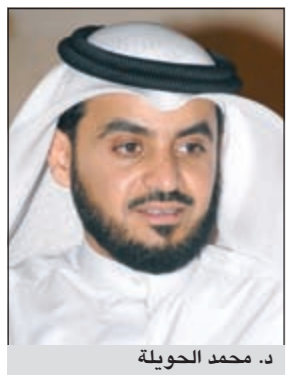
د. محمد الحوية

قدم النائب د.محمد الحوية اقتراحا برغبة جاء فيه نظرا لارتفاع رسوم المدارس الخاصة وبما ان مرحلة رياض الاطفال والمرحلة الابتدائية هي المرحلة التي يبدأ فيها الطفل بالتعامل بشكل يومي مع قرائنه، لذلك تعتبر هذه المرحلة من المراحل الحساسة والمهمة، كما تحتاج الى خصائص مهنية عالية، وان الروضة تشارك الاسرة بشكل رئيسي في بناء القاعدة النفسية والصحية الاساسية للإنسان في مرحلة الطفولة، ولا يستطيع اي منا انكار اهمية الخبرات التي يمر بها الإنسان في هذه المرحلة المبكرة واثراها على حياته المستقبلية، فهو في هذه الفترة يكون سريع التأثر بما يحيط به كما ان