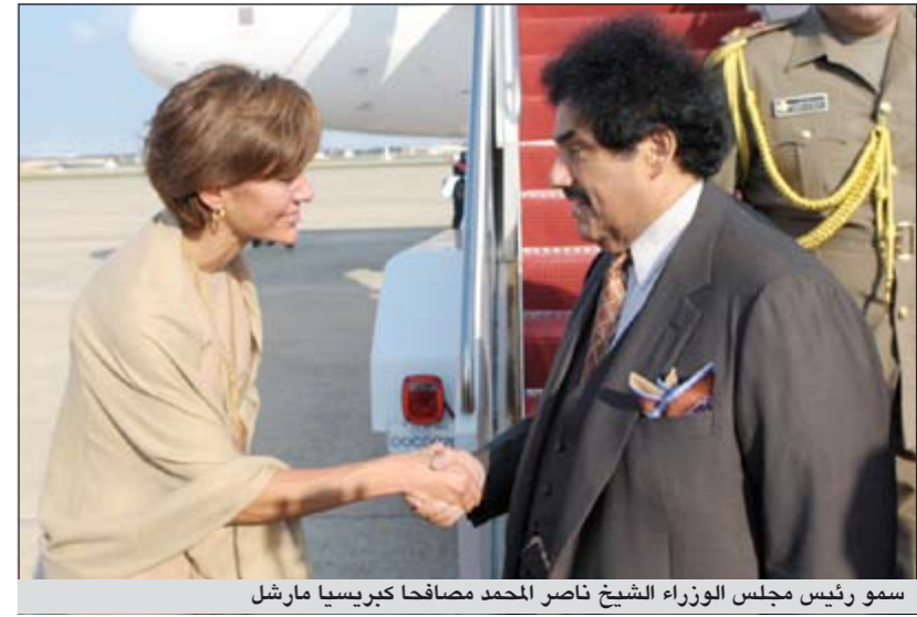
سمو رئيس مجلس الوزراء الشيخ ناصر محمد مصافحا كبريسيا مارشل

على الأصدعة كافة»، وأضاف ان زيارة سمو رئيس مجلس الوزراء تأتي تويجا لمثل هذا التحاور والتشاور مع الولايات المتحدة. وقال ان سمو رئيس مجلس الوزراء سيجتمع اليوم (امس) مع نائب الرئيس الأميركي جو بايدن ووزيرة الخارجية الأميركية هيلاري كلينتون، مضيفاً ان ملف العلاقات الثنائية سيتصدر المحادثات بين الجانبين. وذكر ان هناك أموراً عدة سيبحثها الجانبان منها التعاون العسكري وأمن الخليج موضعا في هذا السياق ان «هناك استحقاقات مقبلة في منطقتنا