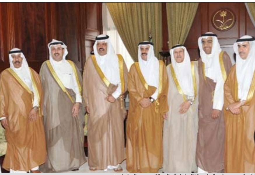
الشيخ حمد جابر العلي خلال زيارته إلى الأمير عبدالعزيز بن سعد

حائل- كونا: ثمن سفيرنا لدى المملكة العربية السعودية الشيخ حمد جابر العلي جهود إمارة حائل وأجهزتها المختلفة في مساعدة المواطنين الكويتيين خلال تواجدهم في حائل. جاء ذلك خلال اجتماع الشيخ حمد امس مع أمير منطقة حائل بالإناة الأمير عبدالعزيز بن سعد بن عبدالعزيز. وقال الشيخ حمد الجابر لـ «كونا» عقب اللقاء الذي جرى اليوم في إمارة منطقة حائل «انني توجت بالشكر الى الامير عبدالعزيز وخواهه العاملين في أجهزة الإمارة المختلفة على ما قاموا به تجاه اشقايتهم الكويتيين الذين تعرضوا للحوادث المرورية في حائل». وأشاد بجهودهم العالية التي أسهمت في تسهيل مهمة علاج المواطنين الكويتيين في مستشفيات حائل وسرعة عودتهم الى البلاد وتذليلهم جميع الصعاب التي قد تعترضهم.