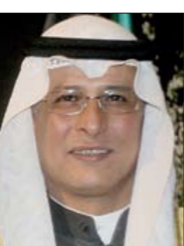
السفير متعب المطوطح

مهاراتهم وتنمية مشاركتهم الفاعلة في المجتمع المدني. وقال ان مؤتمر هذا العام يقام تحت شعار «التحديات غير المحدودة عالمياً». ولفت البيان الى ان المؤتمر حظي باهتمام كبير لدى الحكومة الكويتية تجسد في حضور السيدة الاولى في كوريا وحرر الرئيس لي ميونغ باك والتي لقت كلمة في افتتاح المؤتمر يوم الاثنين الماضي امام نحو 1700 شخص ما بين معاقين واداريين ممثلين عن 57 دولة.