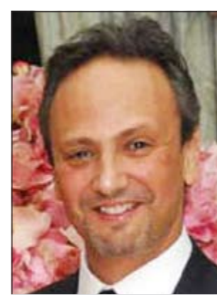
الشيخ سالم العبدالله

على الأصدعة كافة»، وأضاف ان زيارة سمو رئيس مجلس الوزراء تأتي تويجا لمثل هذا التحاور والتشاور مع الولايات المتحدة. وقال ان سمو رئيس مجلس الوزراء سيجتمع اليوم (امس) مع نائب الرئيس الأميركي جو بايدن ووزيرة الخارجية الأميركية هيلاري كلينتون، مضيفاً ان ملف العلاقات الثنائية سيتصدر المحادثات بين الجانبين. وذكر ان هناك أموراً عدة سيبحثها الجانبان منها التعاون العسكري وأمن الخليج موضعا في هذا السياق ان «هناك استحقاقات مقبلة في منطقتنا