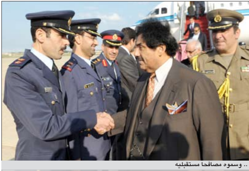
.. وسموه مصافحا مستقبليه

سنوات على تولى صاحب السمو الامير الشيخ صباح الاحمد مقاليد الحكم في شهر فبراير الماضي. وذكر ان الشيخ د.محمد الصباح سيلتقي خلال زيارته التي تستمر يومين مع كبار المسؤولين في الكويت، بهدف الى تعزيز العلاقات الثنائية وتوطيدها. وقال سفيرنا العيار في تصريح لـ «كونا» امس ان زيارة الشيخ د.محمد الصباح تأتي تلبية لدعوة وجهتها له وزيرة الشؤون الخارجية والتعاون الاسبانية ترينيديا وخيمينيث اثناء الزيارة الرسمية التي قام بها العاهل الاسباني خوان كارلوس الاول الى الكويت لحضور احتفالات الميلاد بالذكرى الخمسين لاستقلال والذكري العشرين للتحريير وذكرى مرور خمس