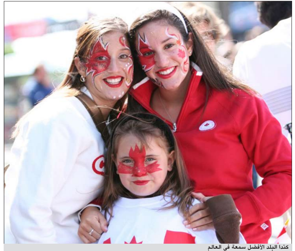
كندا البلد الأفضل سمعة في العالم

مونتريال - أ.ف.ب: كندا هو البلد الذي يتمتع بأفضل سمعة في العالم بحسب استطلاع أميركي للرأي حول صورة خمسين بلداً نشر الثلاثاء. والدراسة التي أجراها معهد «رييوتابيشن اينستيتوت» الذي يتخذ من نيويورك مقراً له عمدت إلى قياس «ثقة الناس وتقديرهم وإعجابهم» تجاه كل بلد بالإضافة إلى نظرهم تجاه نوعية الحياة والأمن والاهتمام بالبيئة في كل واحد من البلدان موضوع الدراسة.