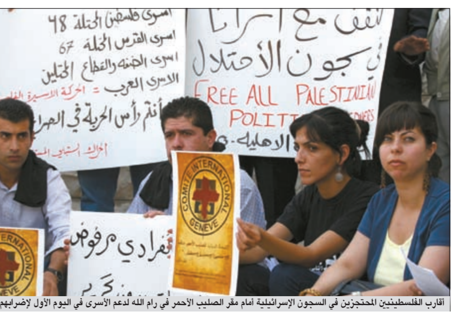
اقارب الفلسطينيين المحتجزين في السجون الإسرائيلية أمام مقر الصليب الأحمر في رام الله لدعم الأسرى في اليوم الأول لإضرابهم