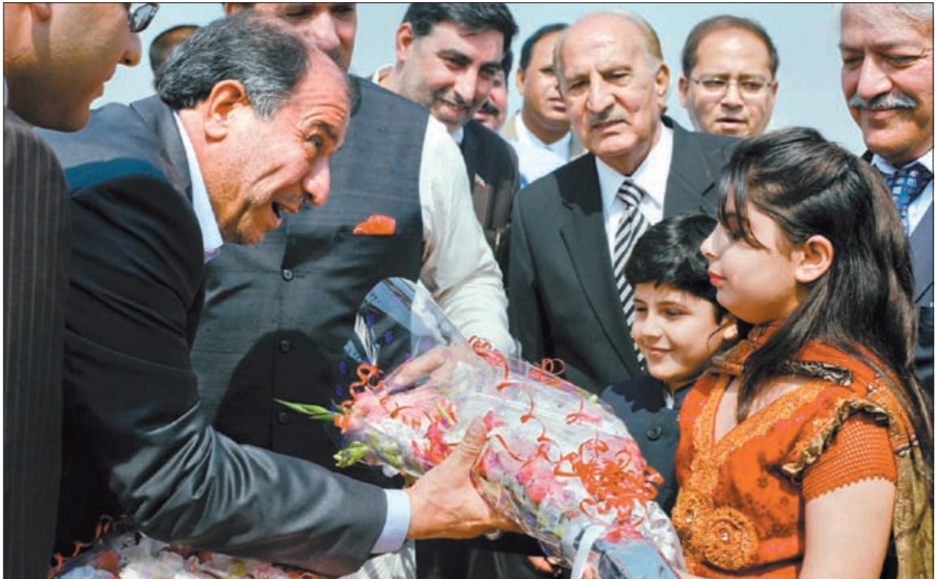
وزير الداخلية الإيراني مصطفى نجار يتلقى باقة من الزهور من الأطفال بعد وصوله إلى قاعدة عسكرية في روالبندي امس

دخلت مرحلة حساسة. مع اخذ دور السعودية بعين الاعتبار، تظهر ضعف الحكومتين القائميتين وسيستج ذلك لا محالة بقطعة إسلامية في البلدين».