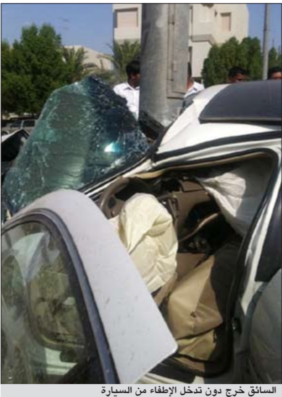
السائق خرج دون تدخل الإطفاء من السيارة