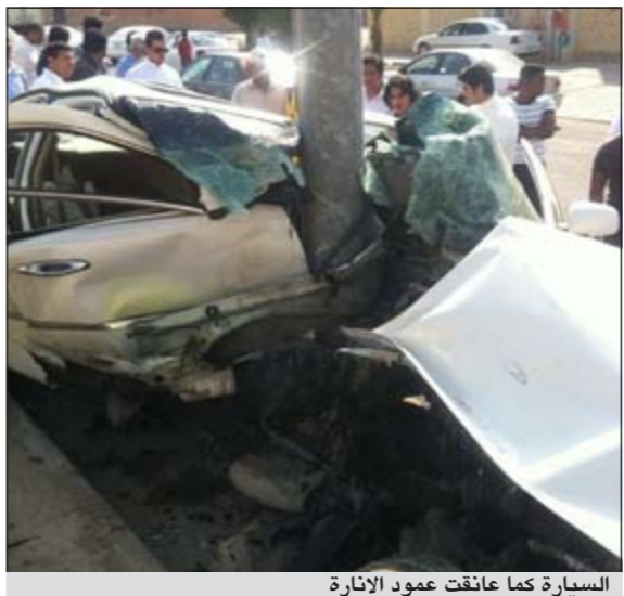
السيارة كما عاينت عمود الإنارة

رغم انشطار المركبة إلى نصفين بفعل اصطدام عنيف بين أمركية وعمود إنارة، إلا أن بطل هذا الحادث حي يرزق. تفاصيل الحادث والذي شهدته منطقة العدلية صباح أمس تضمن اصطدام مركبة مواطن بعمود إنارة وهو ما أدى إلى انشطار المركبة، إلا أن القدر كان رحيماً بقائد المركبة والذي تم اسعافه من قبل مارة لتلقي العلاج.