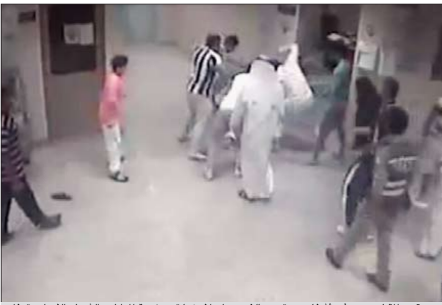
صورة من المقطع ويبدو فيه أشخاص يعتدون بالضرب على آخر كما تبدو زوجة المواطن والشرطي الذي لم يتدخل

في اعقاب انتشار مقطع مصور على أجهزة الهاتف النقال يتضمن إقدام نحو 6 أشخاص على الاعتداء بالضرب على شخص يرتدي الزي الوطني وزوجته، تلقت «الأنباء» سيلاً من الاتصالات الهاتفية للاستفسار عن الواقعة وتاريخ حدوثها، حيث قال مصدر أمّني أن الواقعة تعود إلى شهر سبتمبر الماضي، مشيراً إلى أن مدير أمن محافظة الأحمدى العميد عبداللطيف الوهيب أحال الضابط، والذي لم يتدخل لفض الاشتباك، أماله إلى التحقيق، وأشار إلى أن المعتدين تربطهم علاقة قرابة بالمجنّي عليهم. وقد سجلت قضية بالواقعة حال حدوثها.