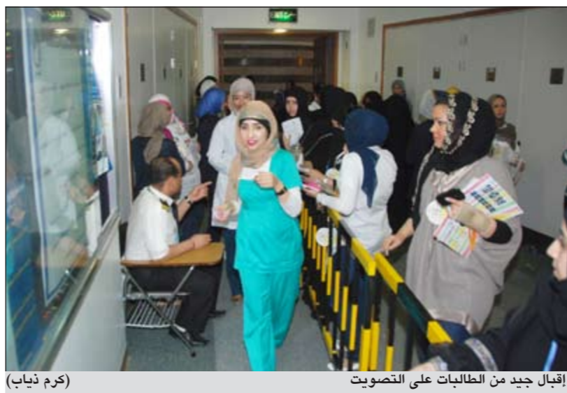
إقبال جيد من الطالبات على التصويت