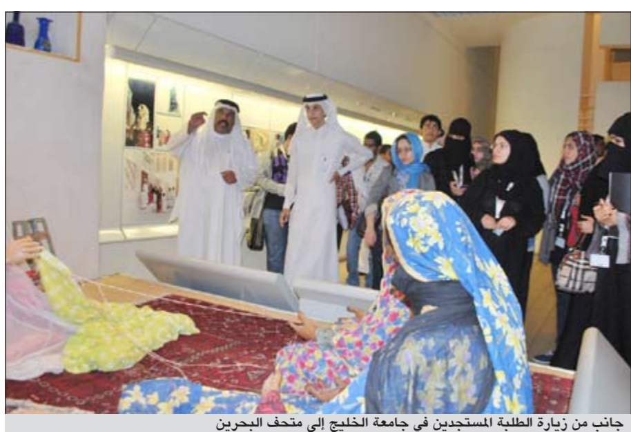
جانب من زيارة الطلبة المستجدين في جامعة الخليج إلى متحف البحرين

والترفيهي يخلق شعوراً لدى الطلبة الجدد بالراحة والانسجام في بيئتهم البحرين. شارك في هذه الزيارة نحو 30 طالباً وطالبة من دول مجلس التعاون الخليجي، تعرفوا على تاريخ وحضارة البحرين وأهم المعالم الأثرية والعادات والتقاليد المجتمعية التي تتجسد في متحف البحرين الوطني، والتي لا تتجزأ عن حضارة الخليج العربي. وأبدى الطلبة إعجابهم بالمعالم والحضارات التي عاشت البحرين عبر الزمن، أملى اكتشاف المزيد من التجارب الحضارية والتراثية المشهورة في البحرين.