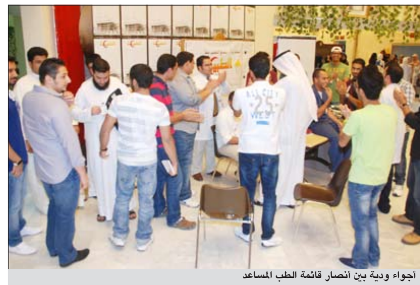
أجواء ودية بين أنصار قائمة الطب المساعد

أعلن مكتبنا الثقافي في القاهرة عن أسماء الدفعة السادسة من الطلبة الكويتيين الذين تم قبولهم بالكليات المصرية الموضحة قرين أسم كل منهم للعام الجامعي 2012/2011. وقال رئيس المكتب د. عيسى الأنصاري إن الطلبة المقبولين عليهم مراجعة المكتب الثقافي لتسلم خطاب موجه للإدارة العامة للوافدين لسداد قدم المؤهل بواقع (500 جنيه مصري فقط لا غير) عن كل عام دراسي سابق عن العام 2011 + رسوم المطروف، مع التنبيه على الطلبة العاملين بالجهات الحكومية لأحضار مؤافقة الديوان على الدراسة كشرط أساسي لاتمام إجراءات التسجيل.