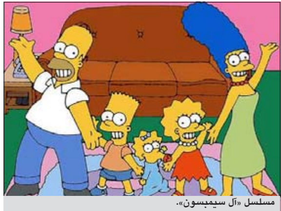
مسلسل «آل سيمبسون».

لوس أنجيليس - يو.بي.أي: يبدو أن مسلسل «آل سيمبسون» الذي يعرض منذ 23 عاما لن سيتوقف في أي وقت قريب بفضل الوساعة، غير أن منتجي البرنامج في شبكة «فوكس» بدأوا يفكرون في سبل جديدة لتحقيق أرباح إضافية من المسلسل الناجح من خلال فكرة إنشاء قناة متخصصة بـ «آل سيمبسون»، وذكرت صحيفة «لوس أنجيليس تايمز» امس أن المدير التنفيذي في شركة «نيو كورب» المالكة للشبكة «فوكس» شايس كاري قال في خطاب أمام مؤتمر في بيفرلي هيلز إن الشركة بدأت تجري محادثات داخلية حول كيفية تحقيق أرباح إضافية من مسلسل «آل سيمبسون»، وأستبعد كاري إلغاء المسلسل في وقت قريب لأنه لا يزال يحظى بشعبية واسعة جدا، ولمح إلى احتمال إنشاء قناة رقمية لا تعرض إلا حلقات من مسلسل «آل سيمبسون».