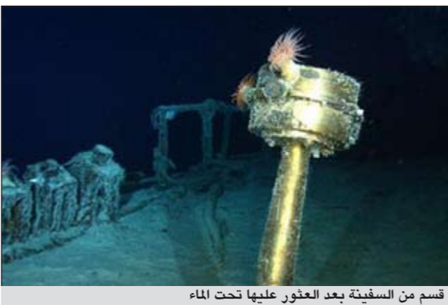
قسم من السفينة بعد العثور عليها تحت الماء

لندن - العربية: بعد عام من البحث والتقصي استمر عثرت شركة غوص أميركية على حطام سفينة تجارية بريطانية أغرقها غواصة ألمانية في الحرب العالمية الثانية، ومعها ابتلع البحر 84 بحارا كانوا على متن سفينة، بينهم عشرات العرب، فاستقرت عند عمق 4700 متر تحت مياه المحيط الأطلسي، وضاعت معها أكثر من 7 ملايين أونصة من الفضة كانت بين حمولتها، وقيمتها الآن 210 ملايين دولار.