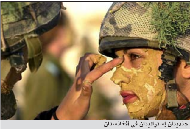
جنديتان إستراليتان في أفغانستان

ولأستراليا حوالي 1550 جنديا في أفغانستان يتركز معظمهم في تيرين كوت عاصمة ارزكان ويشكلون أكبر قوة من خارج حلف شمال الأطلسي في الائتلاف الدولي الذي يقاتل متطرفي طالبان.