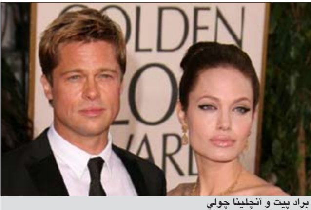
براد بيت و أنجلينا جولي

ويستمتع حاليا النجم براد بيت بمشاهدة المناظر الطبيعية وزيارة الأماكن الأثرية المميزة في شوارع بريطانيا حيث ذهب في جولة عائلية مع أطفاله وزوجته النجمة الأميركية أنجلينا جولي في أوقات استراحتة من تصوير مشاهد الفيلم.