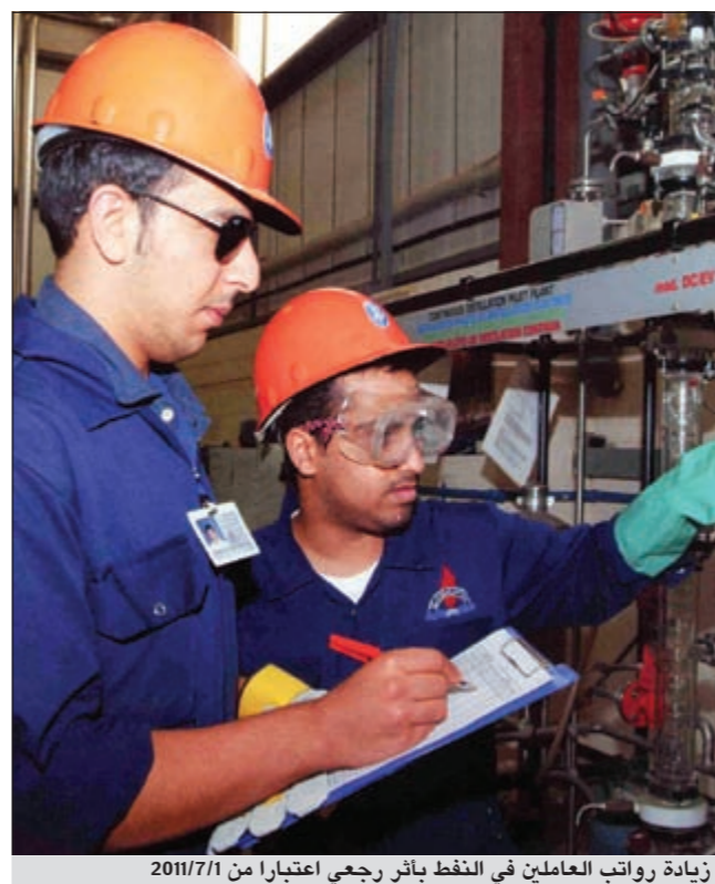
زيادة رواتب العاملين في النفط بأثر رجعي اعتباراً من 2011/7/1

وأوضح أن جميع العاملين على سلم الدرجات الوظيفية بالمؤسسة وشركاتها التابعة تمنح الزيادة العامة على الراتب الأساسي والتي تعادل 20% من أول مربوط درجاتهم الحالية وفق جدول الرواتب قبل التعديل، فإذا كان الراتب الأساسي للموظف بعد الزيادة يقل عن أول مربوط الدرجة وفق جدول الرواتب يمنح