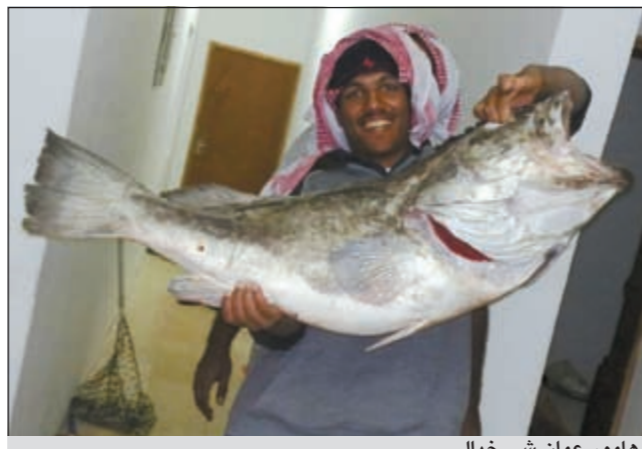
هامور عمان شي خيالي