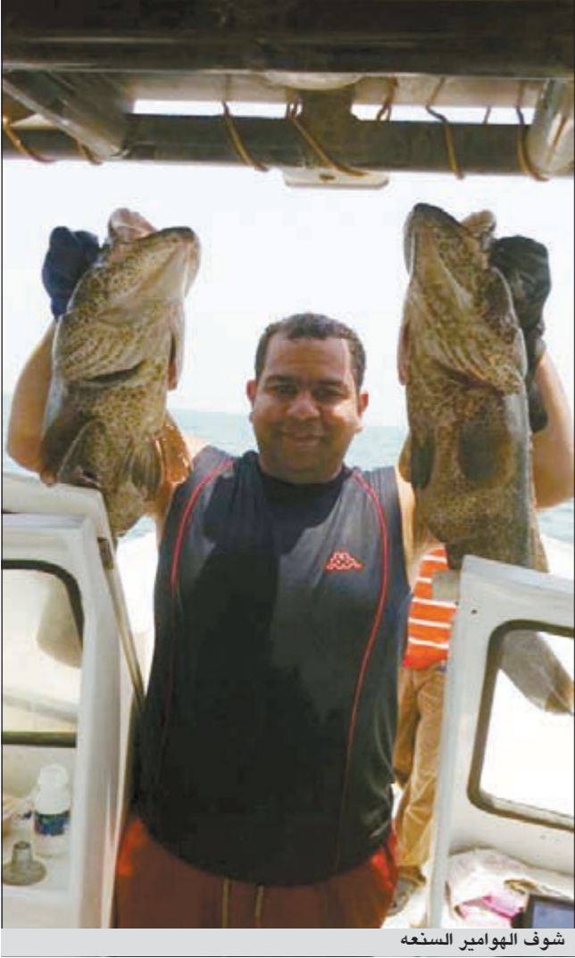
شوف الهوامير الستعة