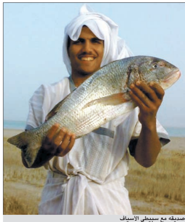
صديقه مع سيبتي الأسياف

هل غصت خارج الكويت؟ ● نعم لقد غصت في دولة قطر بمنطقة جزيرة حالة العسيري ومنطقة شرعوه وجزيرة السافلية.