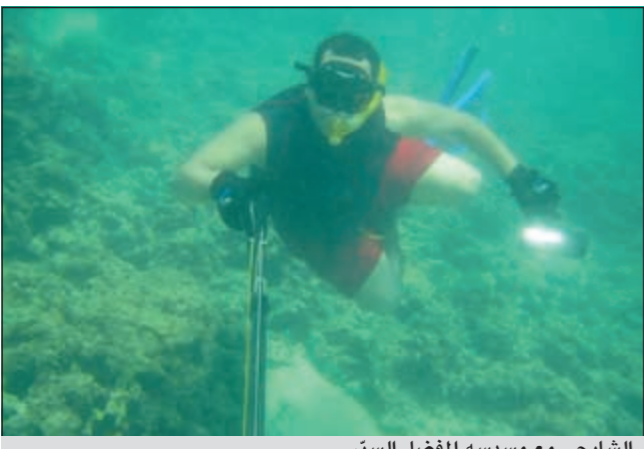
الشايحي مع مسدسه المفضل السير