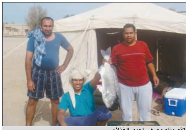
الأصدقاء وعرض إحدى الغنائم