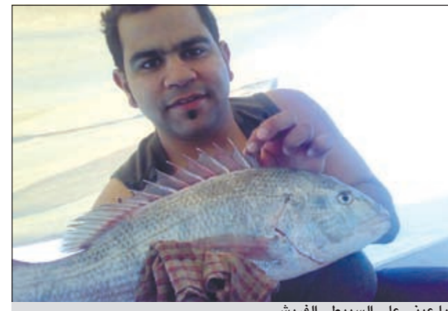
يا عيني على السيبتي الغريش