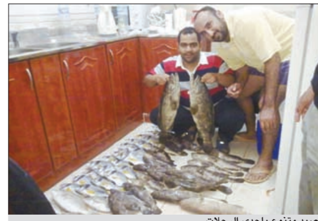
صيد متنوع بإحدى الرحلات