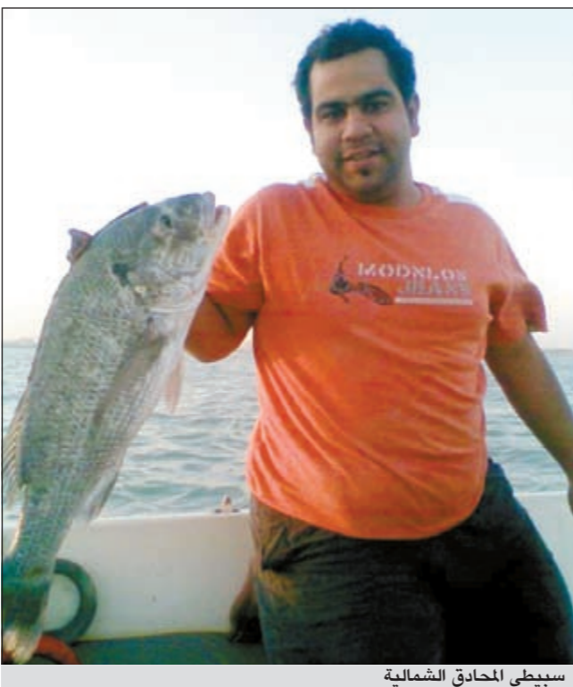
سيبتي المحادق الشمالية

دعوة تحب ان توجهها وإلى من؟ ● أحب ان أوجه دعوتي الي اخواني الحداقة بأن يهتموا بعودة السلامة والإسعافات الأولية كاملة دون نقصان، كما أوجه دعوتي الي اخواني الغواصين الجدد بأن يتعلموا أساسيات الغوص الصحيحة، وفي الختام أدعو للجميع بالسلامة والصيد الطيب.