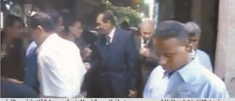
صورة عن الإنترنت لجولة المشير محمد حسين طنطاوي بالزي المدني في وسط القاهرة أمس الأول