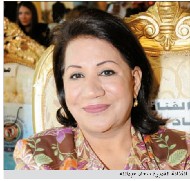
الفنانة القديرة سعاد عبدالله

عبر الكاتب عبدالعزيز الحشاش عن سعادته لبدء تصوير مسلسل التلفزيوني الجديد «غريب الدار» الذي تقوم ببطولته الفنانة القديرة سعاد عبدالله مع نخبة من أبرز نجوم الساحة الفنية الكويتية على رأسهم الفنان إبراهيم الحربي ومرام ويعقوب عبدالله وشيما علي وبثينة الرئيسي وصمود وعبدالله بهمن وشهاب جوهري ومي البلوشي وعبدالله الزيد وشفيقة يوسف وشوق ويتصدي لإخراج المسلسل المخرج القدير غافل فاضل.