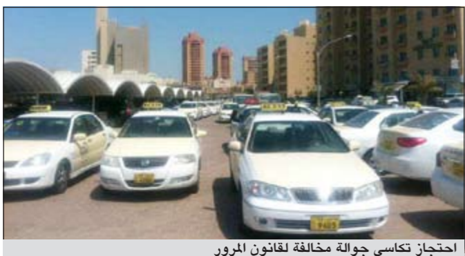
احتجاز تاكسي جواله مخالفة لقانون المرور

استخدام الهاتف النقال أثناء القيادة باليد و126 موقف معاق و422 عداد انتظار و170 مخالفة باصات النقل و45 مخالفات التاكسي الجوال و293 أخرى.