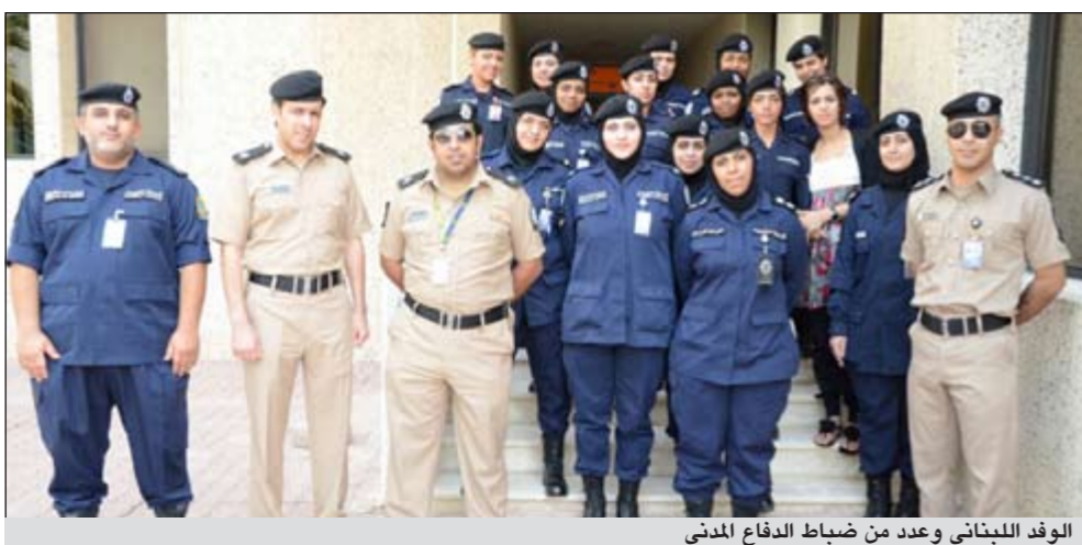
الوفد البلناني وعدد من ضباط الدفاع المدني

وقال اللواء الروضان عقب اجتماعه مع وفد الشرطة النسائية ان وجود العنصر النسائي في الشرطة مهم وذلك في الاعتماد عليهم في الكثير من المهام والواجبات الأمنية في سد جاني كبير من احتياجات أجهزة الأمن في كل المجالات التي تتطلب وجود عنصر نسائي فاعل يستطيع التعامل مع القضايا الاجتماعية والأمنية وغيرها من مجالات العمل الشرطي بكفاءة واستعداد.