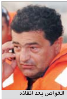
الغواص بعد انقاذه

وقالت الادارة في بيان صحفي امس انه ورد بلاغ الى غرفة العمليات من شخص من الجنسية الروسية، فقد صديقه في البحر حيث كانا خارجين من رحلة غوص بالقرب من جزيرة كبر فتوجه علي الفور كل من مركز انقاذ السالطة البحري ومركز انقاذ الشعبية البحري الى مكان البلاغ. وأضاف البيان ان الغواصين قاموا بعملية البحث بما يقارب الساعتين وتم العثور على الشخص المفقود بمسافة ميلين بحريين عن موقع الغرق وهو في حالة صحية جيدة.