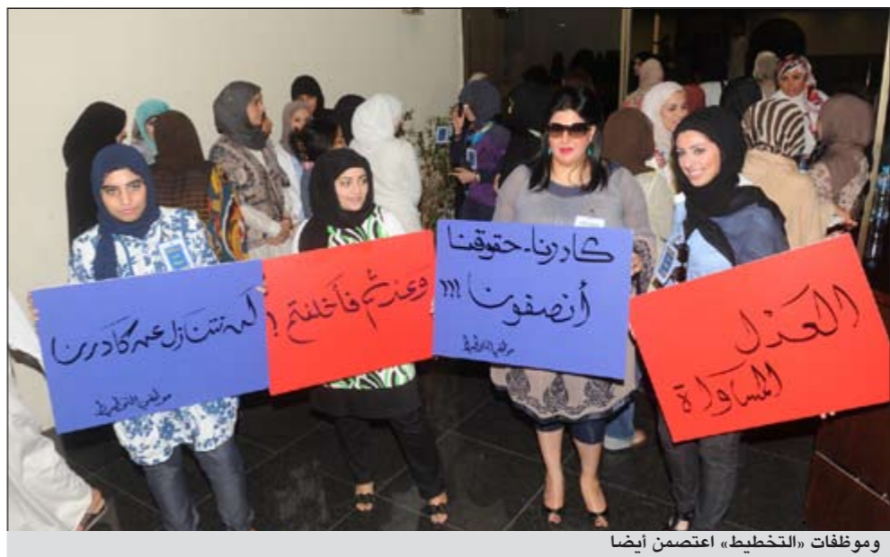
وموظفات «التخطيط»، اعتصمن أيضاً