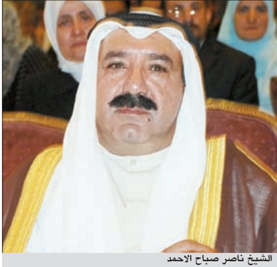
الشيخ ناصر صباح الاحمد

يستقبل وزير شؤون الديوان الاميري الشيخ ناصر صباح الاحمد زائريه الكرام يوم الاثنين الموافق 10 أكتوبر المقبل، وذلك في الديوان السابق لوالده صاحب السمو الامير حفظة الله ورعاه، بمنطقة البدع قرب مسجد الشيخة بدرية الاحمد بين صلاتي العصر والمغرب اسبوعيا.