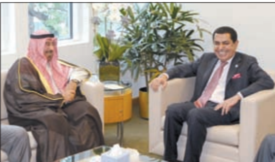
الشيخ د.محمد الصباح لدى لقائه رئيس الجمعية العامة للأمم المتحدة

وأضاف أنه تباحث مع رئيس الجمعية «طويلاً بشأن استراتيجيات تلبية تلك التوقعات الكبيرة والخروج بشيء إيجابي لصالح إقامة الدولة الفلسطينية، خصوصاً في ضوء الدعوة لاستئناف المفاوضات وفي ضوء التماهي في عمليات الاستيطان وسرقة الأراضي». وشدد على أنه «لدينا الآن فرصة ذهبية بعرض هذه المسألة على الجمعية العامة والمطلب تصويت على إعطاء صفة دولة غير عضو لفلسطين في