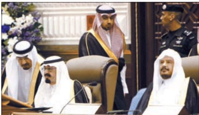
خادم الحرمين الملك عبدالله بن عبدالعزيز خلال إلقاء كلمته في مجلس الشورى بحضور رئيس المجلس عبدالله بن محمد آل شيخ

نوه بعودة الأمن للمملكة البحرين واعتبر المبادرة الخليجية مخرجاً لأزمة اليمن خادم الحرمين يعلن منح المرأة حق العضوية في 'الشورى' والترشح والانتخاب في 'البلدية'