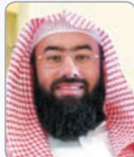
الشيخ د. نبيل العوضي

مشروع الحج الهدى والاضاحي تحت إشراف فضيلة الشيخ د. نبيل العوضي