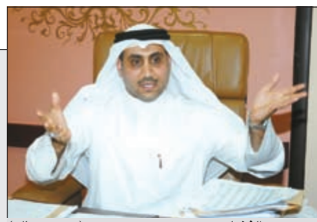
د. مہدی الفضلي (سعود سالم)

السفير السعودي لـ 'الأنباء': في ظل ما تشهده المنطقة.. نحمد الله على استقرارنا وإرهاب وراه قوى مختلفة واستطعنا إحباط الكثير من العمليات 25