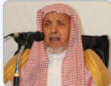
الشيخ حجاج العجمي