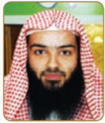
الشيخ حجاج العجمي