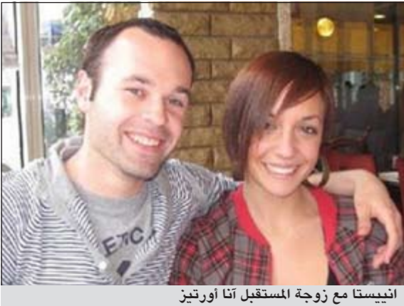
إنيستا مع زوجة المستقبل آنا أورتيز

قرر نجم وفاق برشلونة والمنتخب الإسباني أندريس إنيستا عقد زفافه على الممثلة الأميركية آنا أورتيز في الـ 12 من يوليو 2012 وهو نفس يوم زواج البرتغالي كريستيانو رونالدو مهاجم ريال مدريد على عارضة الأزياء الروسية إيرينا شايبك.