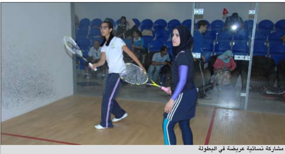
مشاركة نسائية عرضية في البطولة

وأضاف: «كنت أنتظر التقدير على تلك المباراة، ولذلك أتعجب من الخصم لأنني ظهرت على قناة الأهلي، والكل يعلم أنني سطرني وأقدم الحلقة قبل فترة طويلة من مواعدها.. لم يخطن أحد على الإطلاق بأبني سأتعرض لعقوبة». وتوترت علاقة حسن مع الأهلي، وخاصة مع البرتغالي مانويل جوزيه في نهاية الموسم، وتبادل الطرفان التلاسن، قبل أن يخضع قائد منتخب مصر لصفوف الزمالك، في خطوة قد تؤثر على علاقته القوية بالجماهير الحمراء.