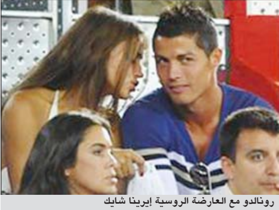
رونالدو مع العارضة الروسية إيرينا شايبك