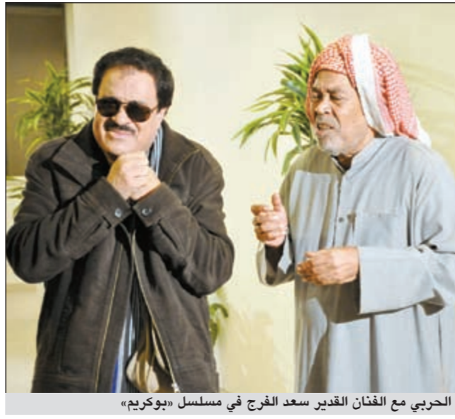
الحربي مع الفنان القدير سعد الفرج في مسلسل «بوكريم»

على الخليجية، حيث قال: بعض الناس ينتقدون علي «الفاضي والمليان»، ويطلقون أحكاماً غريبة، واهية، أنا لا أنكر أنه قد تكون بداية العمل غير مفهومة ولم يتم استيعابها بالشكل الصحيح، لكن بعد ذلك