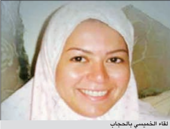
لقاء الخميس بالحجاب

يبدو أن غياب الفنانة لقاء الخميس عن الظهور الإعلامي لفترة طويلة أو المشاركة بالتعبير عن رأيها في الأحداث السياسية المتوترة التي تمر بها مصر جعل جمهور موقع التواصل الاجتماعي يتكهن بارتدائها الحجاب. وقام بعض رواد «الفيسبوك» بنشر صورة للقاء وهي ترتدي الحجاب، ووضعوا فيديو خاصاً بصوتها تقول فيه «سبحان الله.. سبحان الله العظيم.. أدخلني برحمتك جنّتك مع عبادك الصالحين»، وأخذ جمهور الفيسبوك، بحسب ما ذكر موقع «دنيا الوطن»، يعلقون على الصورة قائلين: «رددنا مفرجة» وآخرون قالوا إنها حقيقية وتم تسريبها، وقسم ثالث أخذ يدعو لها بارتداء بالفعل، ومن جانبها لم تعلق لقاء الخميس على الصورة أو الفيديو.