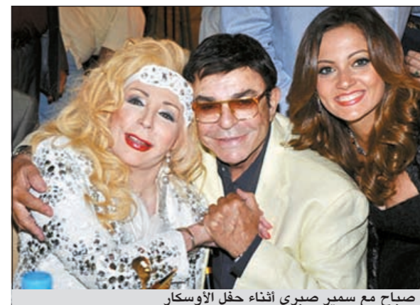
صباح مع سمير صبري أثناء حفل الأوسكار

وعن أداء كارول سماعة في مسلسل «الشحرورة»، قالت صبح: «كان ضعيفا ولكنها اجتهدت، كما أعزرها في ذلك لأنها حاولت ان تقلدني في أدائي التمثيلي وهذا صعب، أما المخرج فأهمّل تفاصيل كثيرة في حياتي وشخصيتي، ولكن المسلسل في مجمله حلو حالتها الصحية وأقربها من سن التسعين. من جانب آخر، عبّرت صباح عن سعادتها بوجودها في مصر، مؤكدة حبها