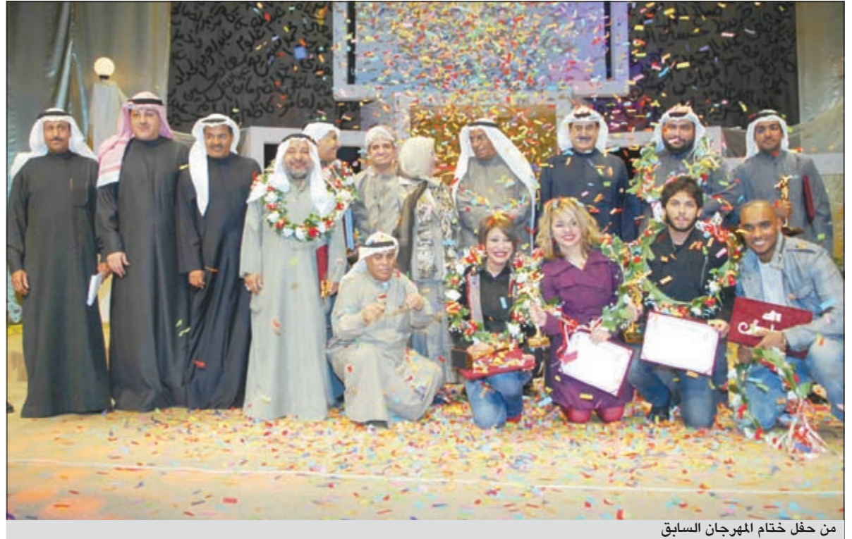
من حفل ختام المهرجان السابق

ولم يسمح خالد سليم بدخول أي من المصورين الذين علموا بالخبر، وسارعوا إلى هناك على أمل أن يظفروا بأول صور لخالد سليم وعروسه، لكن خالد سليم رفض رفضا تاما أن يلتقط له أحد أي صورة وهو برققة عروسه.