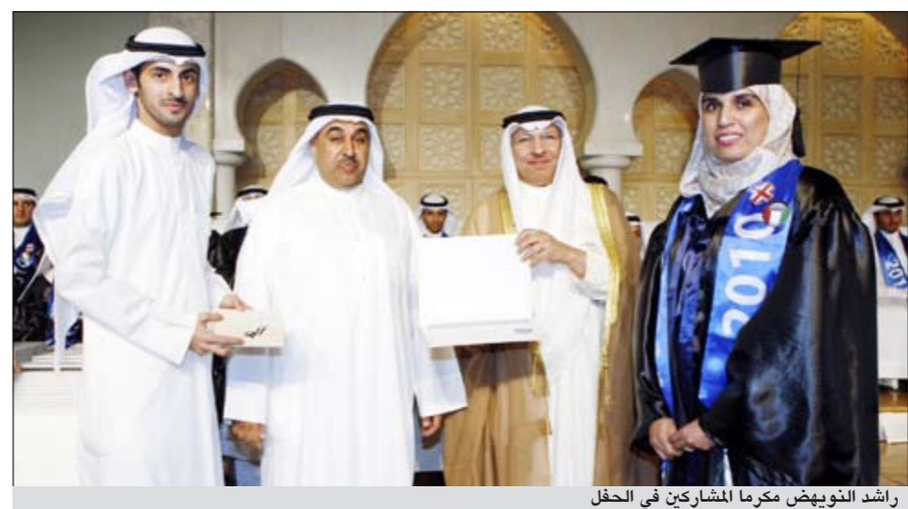
راشد النويهيض مكرما المشاركين في الحفل

والأكاديميين الذين أثنوا بدورهم على دور الاتحاد الرافي. من جانب آخر، أوضح رئيس الهيئة الإدارية في الاتحاد