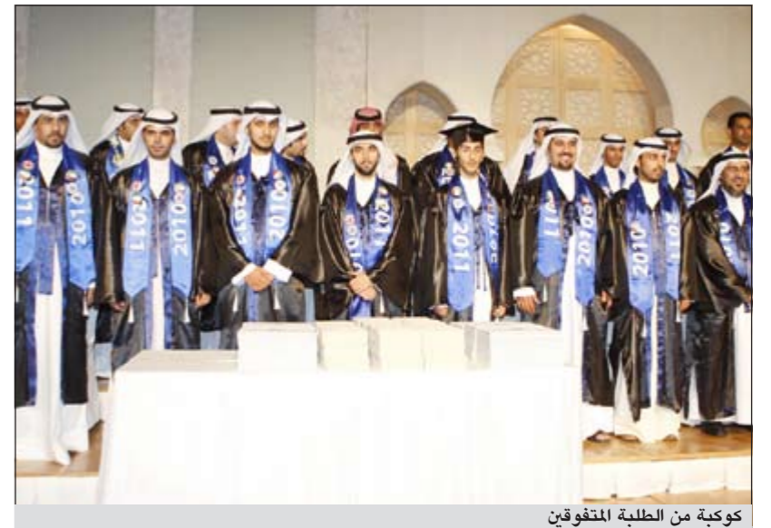
كوكبة من الطلبة المتفوقين