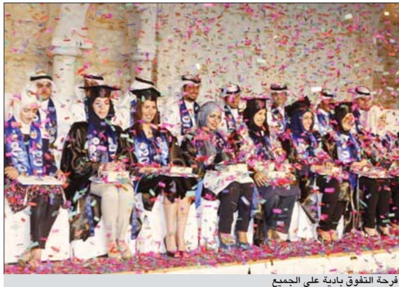
فرحة التفوق بادية على الجميع