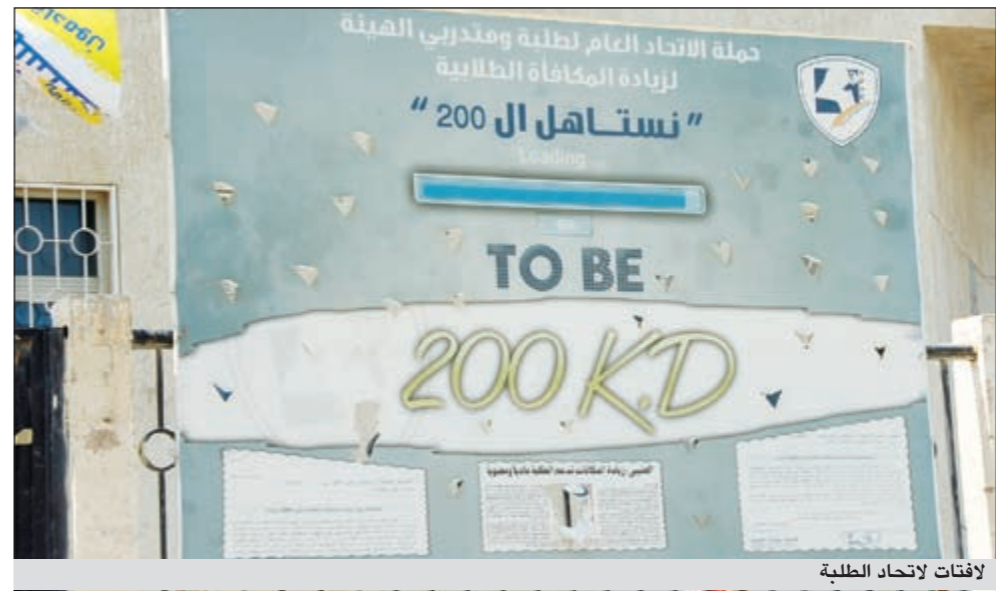
لافتات لاتحاد الطلبة

حقا انه عرس ديمقراطي ذلك الذي نشهده في بداية كل عام دراسي داخل أروقة الجامعة والهيئة العامة للتعليم التطبيقي والتدريب، والمتنوع للمشهد الانتخابي الطلابي لا يسعه إلا أن يحكم عليه بأنه صورة مصغرة للانتخابات البرلمانية، ولما لا وقد ذهب كل فريق لحشد طاقاته وإمكاناته لاكتساب المزيد من الأنصار الجدد.