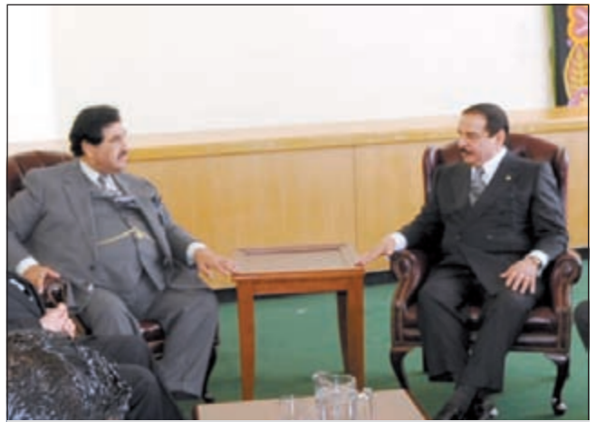
ملك البحرين الملك حمد بن عيسى لدى لقائه ممثل صاحب السمو

العنف التي راح ضحيتها الآلاف لابد أن تتوقف حقناً للدماء ولابد أن تتم الاستجابة للمطالب المشروعة للشعوب وتنفيذ اصلاحات سياسية واقتصادية واجتماعية جادة وسريعة، مبنياً ان الكويت تدعم جميع الجهود الداعية إلى الحوار والتفاهم ونبد العنف. وأعلن ممثل صاحب السمو التزام الكويت بتقديم كل أشكال