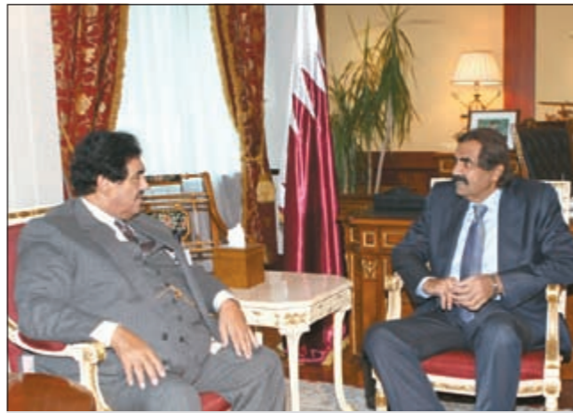
امير قطر الشيخ حمد بن خليفة مستقبلاً سمو الشيخ ناصر المحمد

عالي عادل ومتوازن ومنصف يردم الفجوة الهائلة بين الدول ويحقق المنفعة المتبادلة ويساعد على دمج اقتصاد الدول الفقيرة بالنظام الاقتصادي العالمي، كما أن الدول الاقصدمة لابد أن تفي بالتزاماتها وتزيد من مساعيها التنموية الرسمية وصولاً إلى النسبة المقررة دولياً وهي 0,7٪. التفاصيل ص3