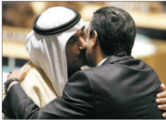
سمو رئيس الوزراء محمداً الرئيس الإيراني أحمدى نجاد

عالي عادل ومتوازن ومنصف يردم الفجوة الهائلة بين الدول ويحقق المنفعة المتبادلة ويساعد على دمج اقتصاد الدول الفقيرة بالنظام الاقتصادي العالمي، كما أن الدول الاقصدمة لابد أن تفي بالتزاماتها وتزيد من مساعيها التنموية الرسمية وصولاً إلى النسبة المقررة دولياً وهي 0,7٪. التفاصيل ص3