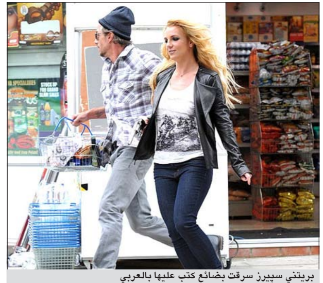
بريتني سبيرز سرت بضائع كتب عليها بالعربي

وتجمع عدد من المعجبين والمعجبات لمراقبة أحداث تصوير المغنية الشابة لأغنياتها الأخيرة، حيث تلعب فيها دور سارقة تحمل مسدسا تهدد فيه البائع