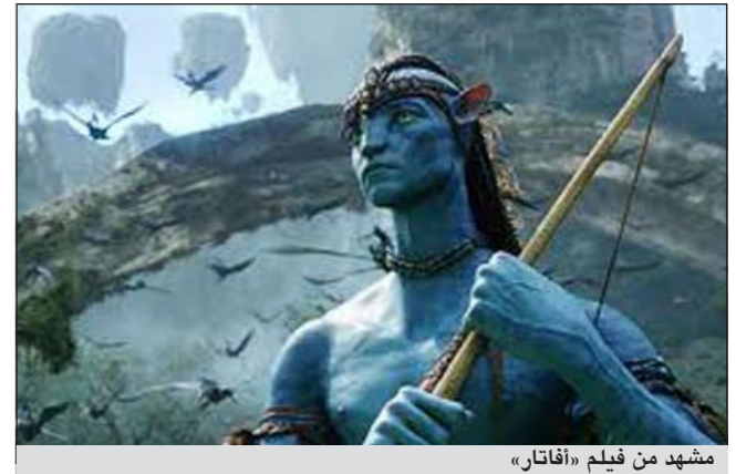
مشهد من فيلم «أفاتار»

لوس انجيليس - أ.ف.ب: ستضم المتنزهات التابعة لمجموعة «ديزني» كوكب باندورا الذي اخترعه المخرج جيمس كامرون في فيلمه «أفاتار» إلى تصاميمها، على ما أعلنت