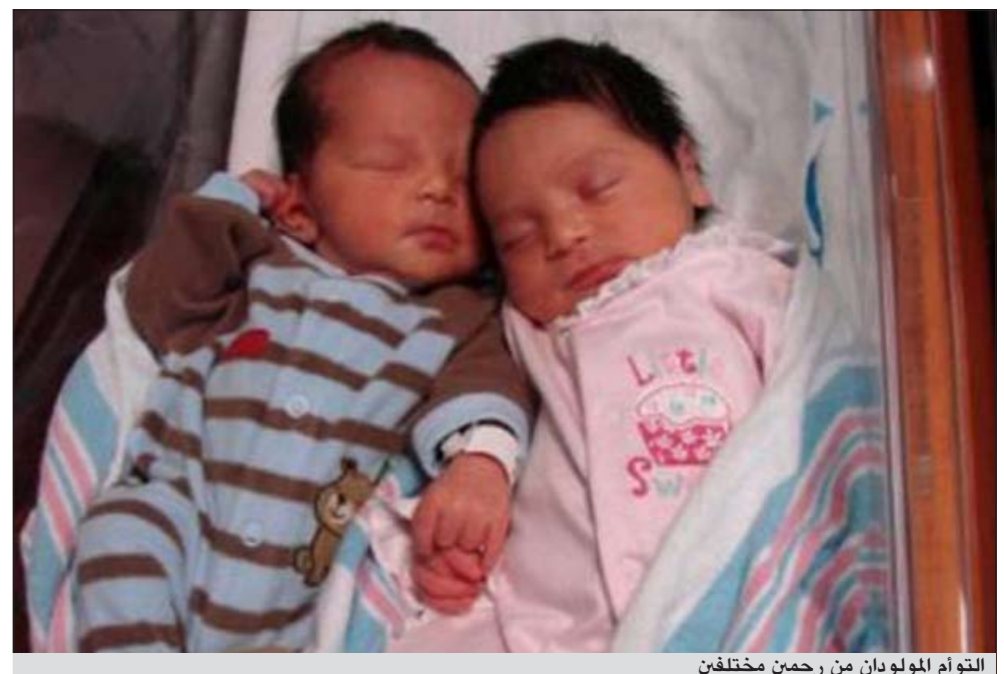
التوأم المولودان من رحمين مختلفين

الرحمين المنفصلين. وأضافت «كنت خائفة وجزعة من الأمر».