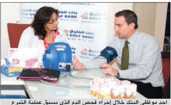
احد موظفي البنك خلال إجراء فحص الدم الذي يسبق عملية التبرع

أعلن بنك الخليج عن اقامته اليوم الفتح للتبرع بالدم في فرعه الرئيسي في شارع مبارك الكبير يوم 19 سبتمبر الجاري، حيث كانت الدعوة للتبرع عامة لجميع العملاء والموظفين وغيرهم من الزود، وقد وفر بنك الدم المركزي عيادة متخصصة داخل مقر البنك جهزت بالكامل لاستقبال المتبرعين من الساعة 9:00 صباحاً إلى 1:00 ظهراً. وقال البنك في بيان صحفي أن هذه الحملة تأتي في إطار عدد من المبادرات التي تبناها بنك الخليج في مجال التبرع بالدم والعمل على زيادة مخزون بنك الدم الذي عانى مؤخراً من نقص في فصائل دم معينة من شأنها أن تهدد حياة العديد من المرضى، ومن تلك المبادرات التي تبناها بنك الخليج رعاية حملة «لون الكويت بالأحمر» التي