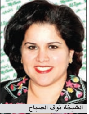
الشيخة نوف الصباح

يحرص التجاري على إحيائها من خلال رزنامات التجاري السنوية. يشار إلى انه يمكن لهواة جمع الطوابع مراجعة وزارة المطابع - قطاع البريد، قسم هواة الطوابع اعتباراً من اليوم للحصول على نسخة من الإصدار الأول لهذه الطوابع.