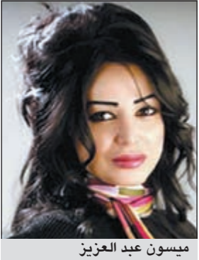
ميسون عبد العزيز

من دون مقدمات غير النجم عمرو دياب صورة بوستر الألبوم الجديد «بناديك تعالي» قبل طرحه في الأسواق أيام قليلة، حيث طرح «بوستر» جديداً للألبوم يظهر فيه دياب جالسا ويرتدي «t-shirt» أبيض ووراء خلفية رمادي، وتم توزيع البوستر على محلات الكاسيت وفي الشوارع والميادين. وكان دياب طرح «بوستر» مختلفاً للألبوم في البداية وكان يرتدي فيه دياب «تي شيرت» رمادي ووراء خلفية سوداء. ولم تكشف «روتانا» أو عمرو دياب عن سر تغيير البوستر، ويات السؤال الذي يطرح نفسه بقوة، هل رأى دياب أن بوستر الألبوم ليس مناسباً، أم أنه أراد أن يجذب جمهوره أكثر إلى الألبوم. من ناحية أخرى، تطرح «روتانا» خلال أيام أغنيتين جديدتين من الألبوم على قناتها الفضائية كدعاية للألبوم وهما