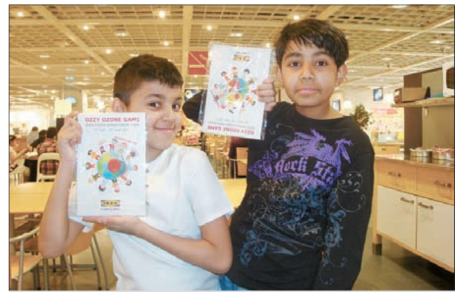
طفلان يشاركان في احتفالات إيكيا الكويت باليوم العالمي لحماية الأوزون

معرض إيكيا في الأفتنيوز للمشاركة في أنشطة هذا اليوم العالمي الذي بدأت إيكيا الكويت الاحتفال والمشاركة به من 15 سبتمبر وحتى 22 سبتمبر، حيث شملت أنشطة الحدث مشاركة العديد من الأطفال بتسليم ألعاب مخصصة تم تصميمها، بحيث توفر لهم معلومات وإرشادات توعوية بسيطة وسهلة حول طريقة المساهمة في الحفاظ على طبقة الأوزون وحماية البيئة. وشهد هذا الأسبوع الخاص في إيكيا العديد من الأنشطة والألعاب التفاعلية المملية والمرح والمتعة، والتي تساعد بشكل لطيف وميسر على توعية الأطفال على بعض السلوكيات الحياتية التي من شأنها حماية البيئة وطبقة الأوزون. هذا وتدعو إيكيا الكويت جميع الزوار والراغبين بالمشاركة في هذه الأنشطة الخاصة باليوم العالمي لحماية طبقة الأوزون، وذلك من خلال زيارة معرض إيكيا الكائن في الأفتنيوز لتسليم ألعاب إضافية بهدف التعرف على العديد من النصائح التي تساهم بشكل فاعل في حماية البيئة وطبقة الأوزون.