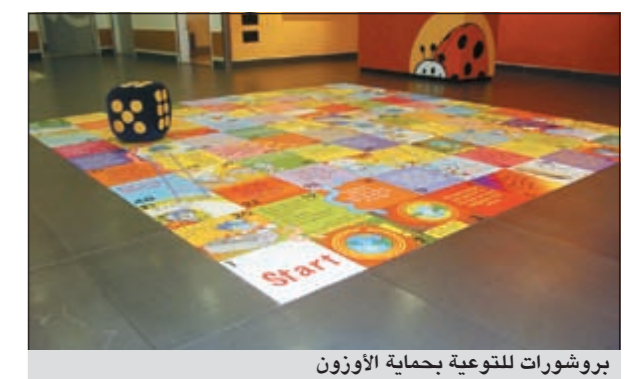
بروشورات للتوعية بحماية الأوزون

ضمن احتفال إيكيا الكويت باليوم العالمي لحماية طبقة الأوزون، مازال الكثير من العائلات وأولادهم يزورون