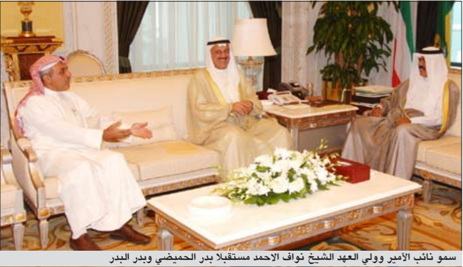
سمو نائب الامير وولي العهد الشيخ نواف الاحمد مستقبلاً بدر الحميضي وبدر البدر

سورية الشقيقة وينتج عنها سقوط اعداد كبيرة من القتلى والجرحى من المدنيين». ودعا الى «الحكمة والعقل لمعالجة الاسباب الحقيقية للازمة والعمل بشكل جاد على البدء في عملية اصلاحات فورية جادة تلي التطلعات المشروعة للشعب السوري الشقيق قبل فوات الأوان». في الوقت ذاته ناشد السفير رزوقي السلطات السورية «اجراء حوار وطني شامل يضمن المشاركة الفاعلة لجميع قوى