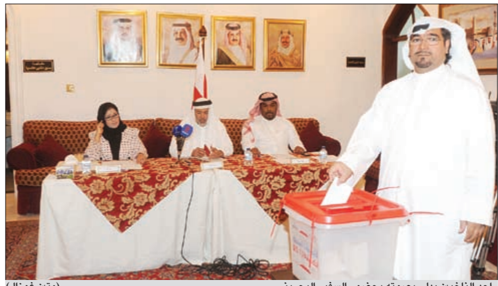
احد الناخبين يدلي بصوته بحضور السفير البحريني (مقن غوزال)