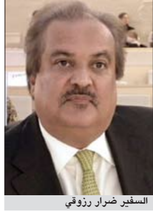
السفير ضرار رزوقي

جنيف - كونا: دعت الكويت امام مجلس حقوق الانسان امس سورية الى التعاون مع لجنة التحقيق الدولية وكافة آليات مجلس حقوق الانسان من اجل التوصل الى نتائج ايجابية تساعد على ايجاد الحلول المناسبة لإنهاء الاحداث المؤلمة للجميع. وشدد مندوبنا الدائم لدى الامم المتحدة في جنيف السفير ضرار رزوقي في كلمة بالاداء امام جلسة الحوار التفاعلي للمجلس حول الأوضاع في