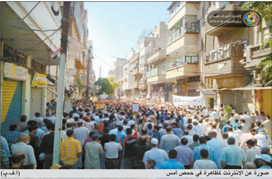
صورة عن الانترنت لظاهرة في حمص أمس

وجود رغبة حقيقية لدى القيادة السورية في القيام بإصلاحات في سورية وتحقيق التحول السياسي الحقيقي والحفاظ على الوحدة الوطنية.