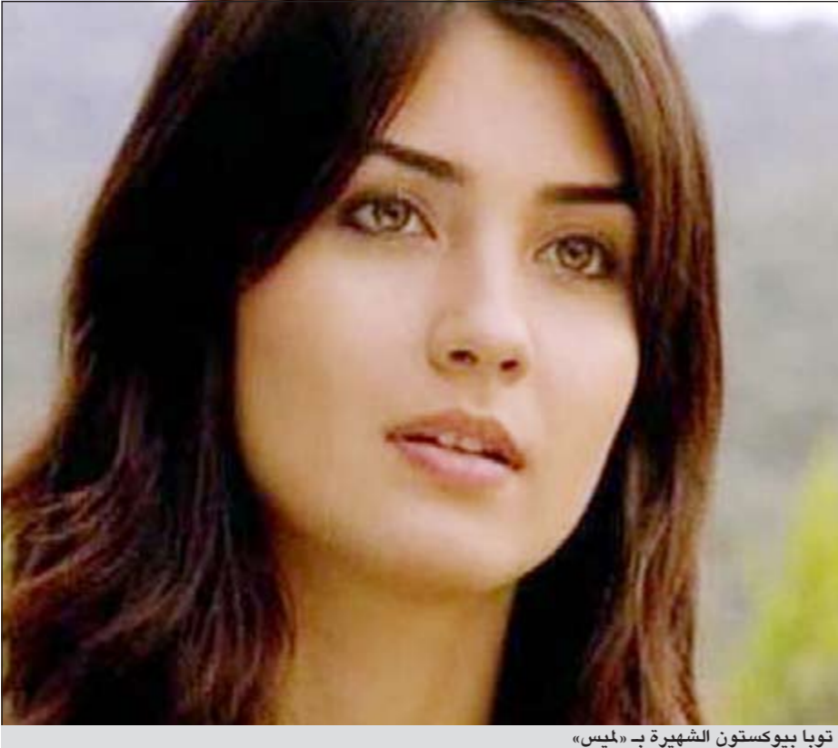
توبا بيوكستون الشهيرة بـ «لميس»

إسطنبول - وكالات: تاكدت الفنانة توبا بيوكستون الشهيرة بـ «عاصي ولميس»، بطلة مسلسل بائعة الورد، أنها حامل في بنتين توأم، وذكرت صحيفة ملييت التركية أن «لميس»، الحامل في شهرها الرابع، خضعت مؤخراً لصورة صوتية تبين من خلالها أنها حامل ببنتين، بما يضع نهاية لكل التوقعات حول نوع توأمها، وقد أعربت هي وزوجها أونور صايلاك عن سعادتهما حينما علما ذلك.