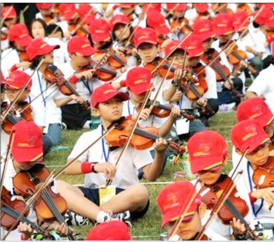
عدد من المشاركين في تجمع التلاميذ للعزف

تايبيه - أ.ف.ب: تجمع أكثر من 4600 تلميذ تايواني أمس الأحد في إطار جلسة عزف جماعية مضمين الرقم القياسي العالمي الذي كان صامداً منذ 86 عاماً.