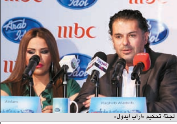
لجنة تحكيم «أراب آيدول»