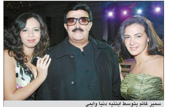
سمير غانم يتوسط ابنتيه دنيا وايمي

شائعة وفاته بسرعة مذهلة ودون ذكر اي تفاصيل، مما اصاب زوجته دلالة عبدالعزيز ابنته دنيا وايمي بشبه انهيار بعد تزايد عدد المكالمات الهاتفية عليهن للتأكد من صحة الخبر. وبادرت زوجته الفنانة دلالة عبدالعزيز بنفي الخبر قائلة: سمير بخير موضحة انها فوجئت بالخبر