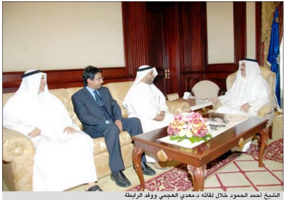
الشيخ أحمد الحمود خلال لقائه د.معدى العجمي ووفد الرابطة

المقترح لتعديل رواتب الهيئة التدريسية بما يتناسب مع وضعها الاجتماعي والجهود التي تبذلها للارتقاء بالعملية التعليمية، وطالبت الرابطة بعرضه على مجلس الخدمة المدنية، حيث لفت رئيس الرابطة د. معدى العجمي إلى أن بعض خريجي كليات التطبيقي يتقاضون رواتب في جهات عملهم تفوق رواتب أعضاء هيئة التدريس وهذا غير منطقي. وتوجه د.الحنين نيابة عن أعضاء الرابطة بجزييل الشكر والعرقان للشيخ أحمد الحمود على حسن استقباله لوفد الرابطة وسعة صدره في الاستماع لقضايا ومهم الهيئة التدريسية، مشيراً إلى أن الوزير الشيخ أحمد الحمود تفهم مطالب الرابطة ووعد بتعزيز مبدأ المساواة في الكوادر بين الجامعة والتطبيقي، كما وعدنا بالنظر في جدول الرواتب الذي اقترحت الرابطة (الكادر) في ظل توجه الدولة الجديد الخاص بالرواتب بشكل عام.