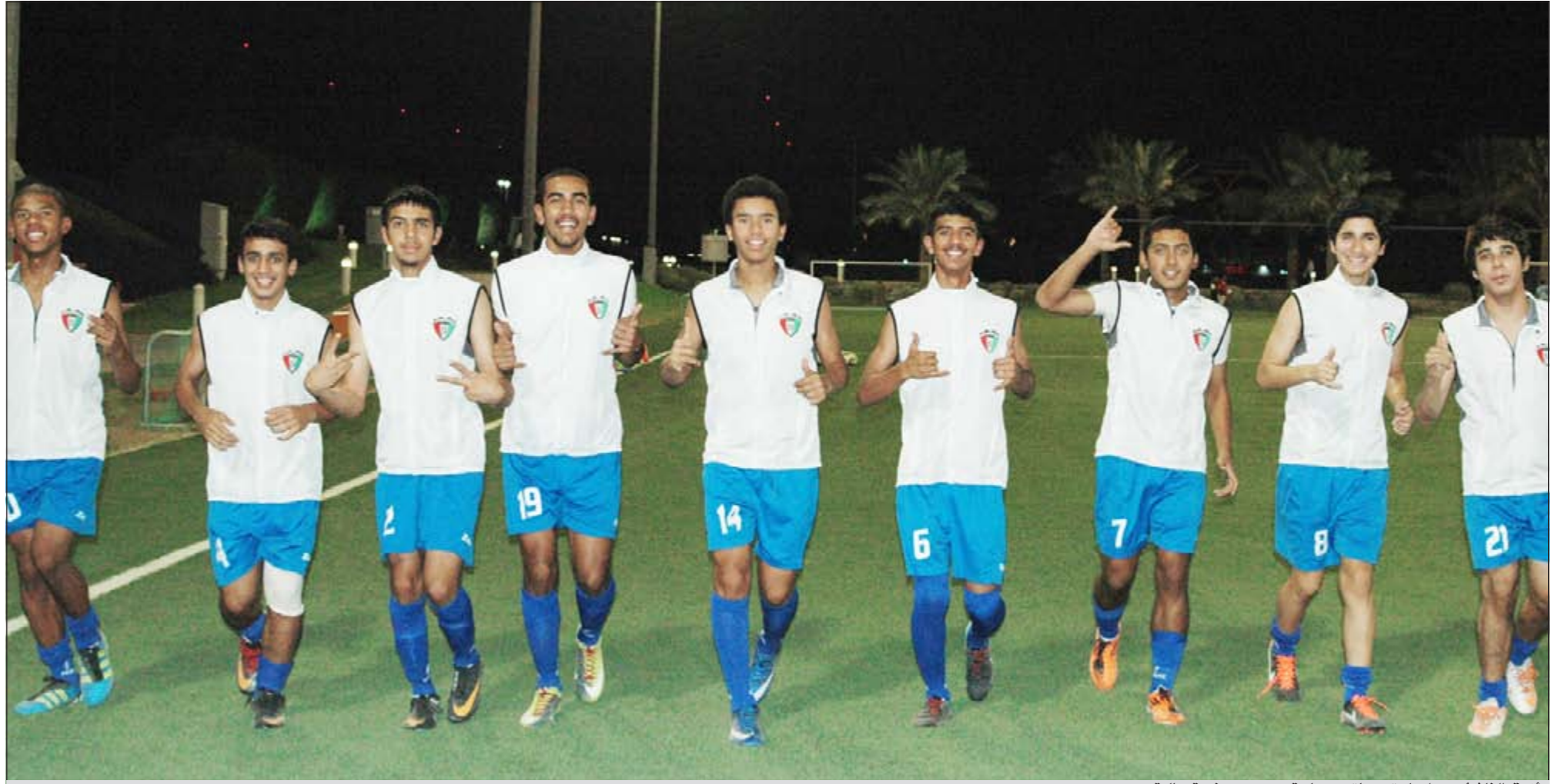
أزرق الناشئين يواصل تدريباته بحماسة وبروح معنوية عالية

وأشار المناع إلى أن تلك الخطوة تأتي من إطار دعم المؤسسة لمشوار المنتخب حيث تم وضع شعار «شجع الأزرق» من أجل تحقيق الفوز ومواصلة المنافسة للتأهل للمرحلة المقبلة بعدما حل الأزرق في الترتيب الثاني بالمجموعة الثانية وبفارق الأهداف عن المنتخب الكوري الجنوبي».