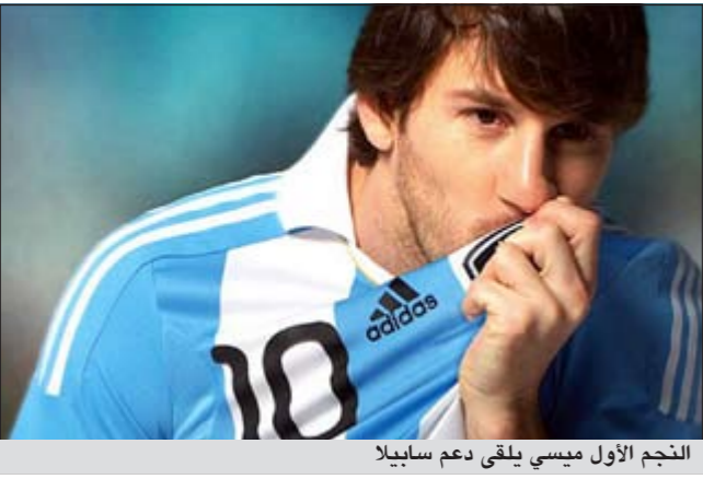
النجم الأول ميسي يلقي دعم سابيللا