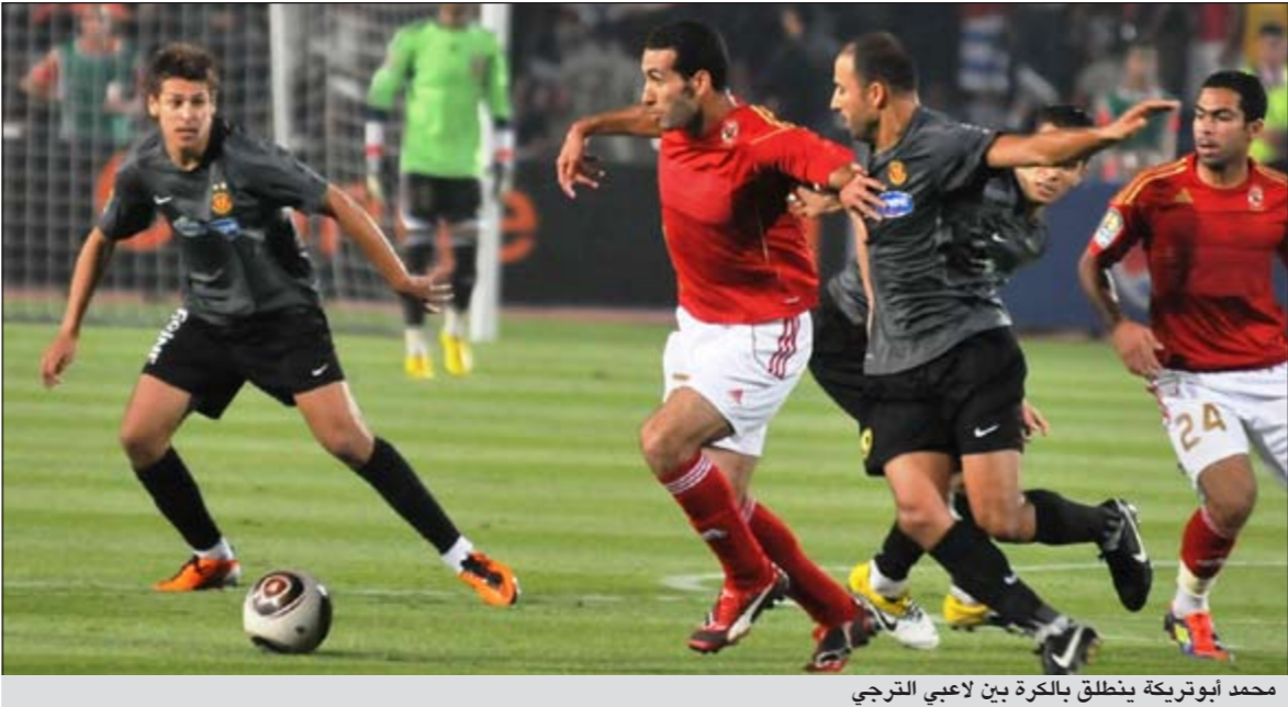
محمد ابوتريكة يتنقل بالكرة بين لاعبي الترجي