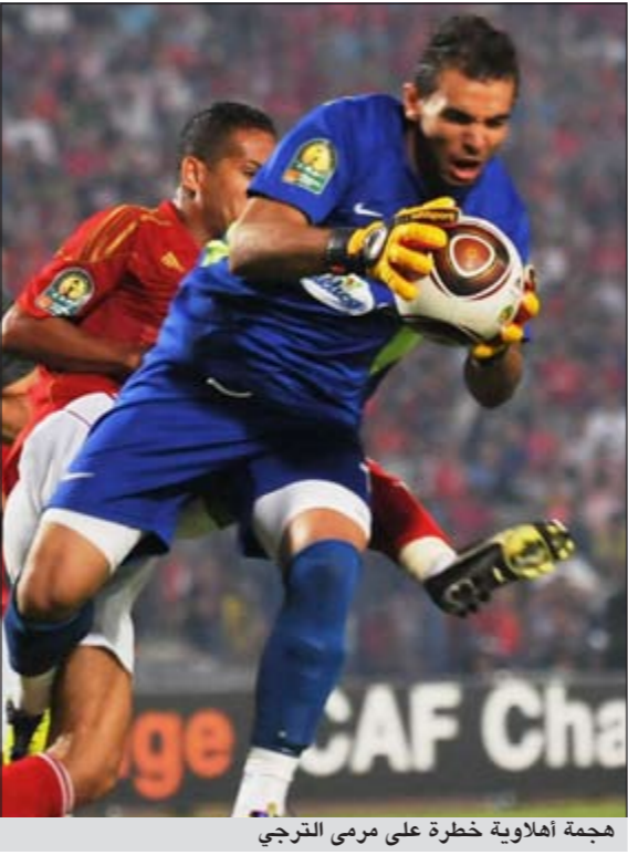
هجمة اهلامية خطيرة على مرمرى الترجي