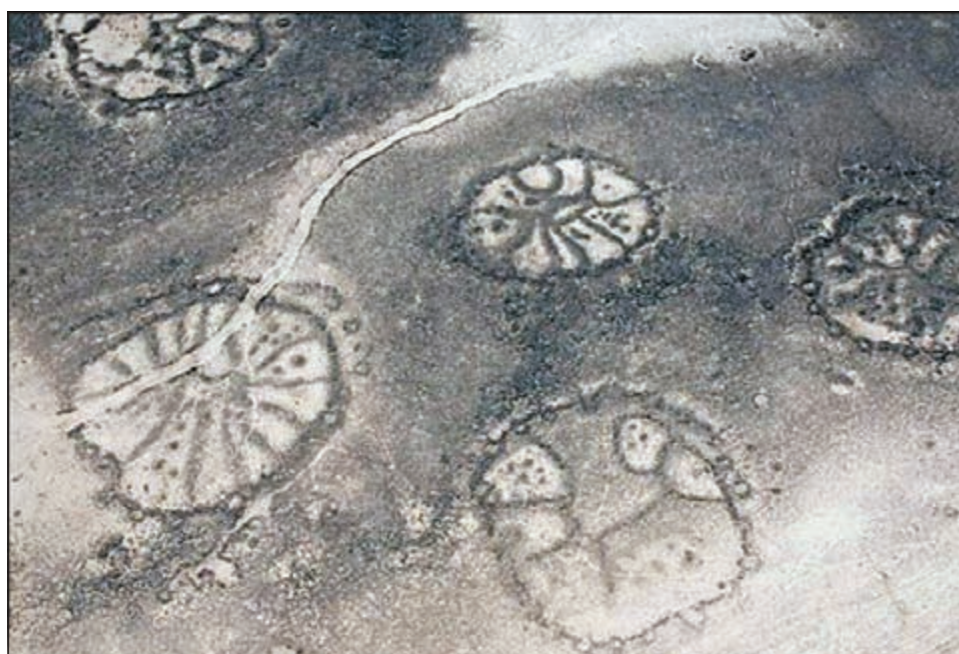
الرسومات الأرضية العملاقة

رؤيتها الا من ارتفاعات عالية، وطرح عدة نظريات حولها، ومنها ان من بنوها تلقوا مساعدة من مخلوقات فضائية، ودلوا على ذلك بقولهم: ان تلك الاشكال رسمت قبل آلاف السنين بدقة عالية لا يمكن ان تتم الا اذا كان هناك موجة من الاعلى، وفي ذلك الوقت لم يكن الانسان قد اخترع الطائرات او المناطيد بعد.