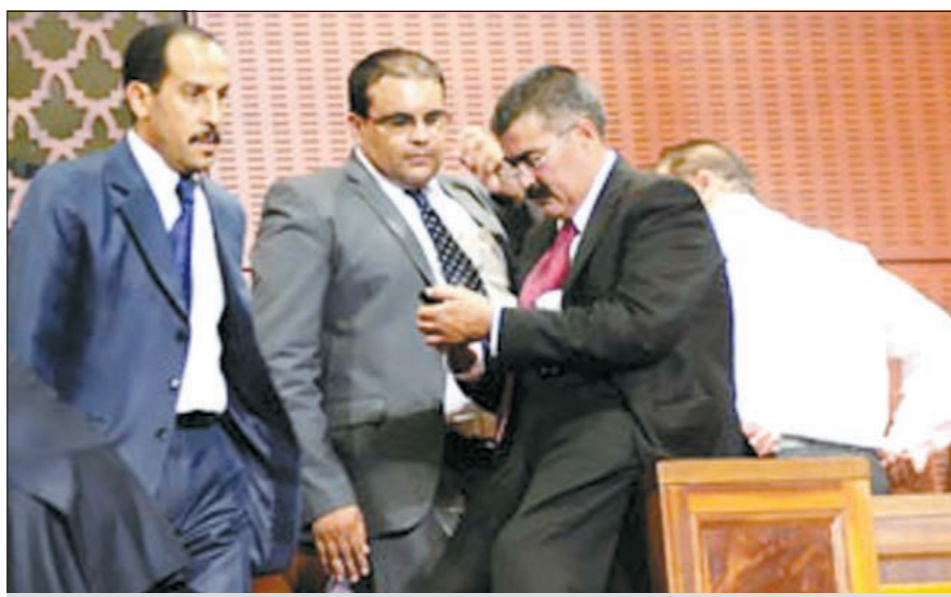
النائب المغربي السكران يعاين هاتفه النقال قبل اخراجه من الجلسة

التي كانت مخصصة للمصادقة على قوانين الانتخابات المقبلة. وقد علق أحد الطرفاء على المنظر الذي بدا فيه البرلمان المخمور بالقول: ترى لو كان الملك هو الذي أفتتح دورة البرلمان، هل كان هذا البرلمان سيدخل القبة سكران؟ ونقلت صحيفة «هيسبريس» المغربية الإلكترونية عن نائب