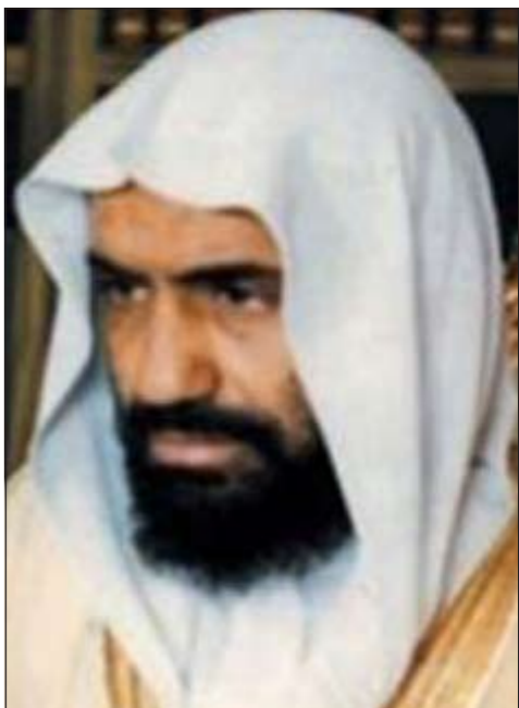
الشيخ صالح بن سعد اللحيدان

والاصول والاسس التي وردت في القرآن على سبيل القياس.