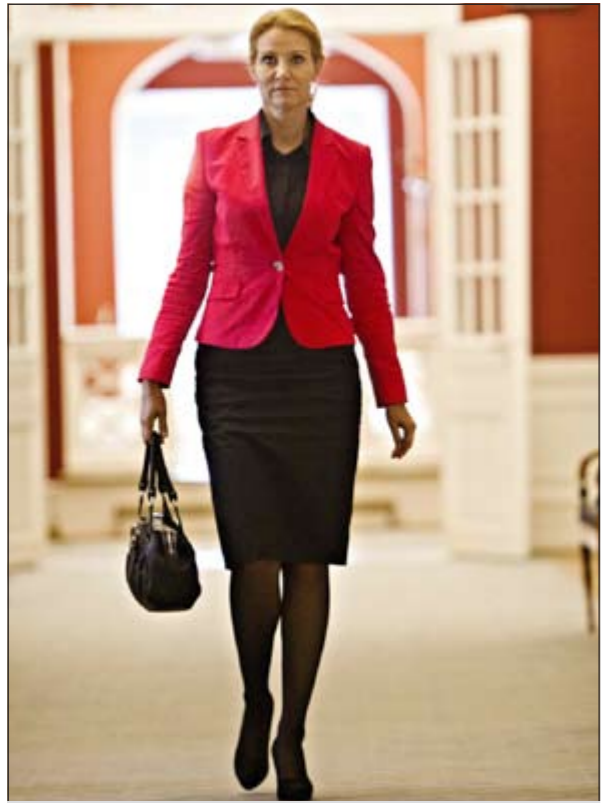
زعيمة المعارضة ورئيسة وزراء الدنمارك المقبلة هيلين ثورنينغ (رويتزن)

وكان الحزبان قد اضطرا إلى الاعتماد على المساندة الخارجية لحزب الشعب الدنماركي والذي استخدم دوره في التأثير بقوة على سياسات الهجرة المتشددة