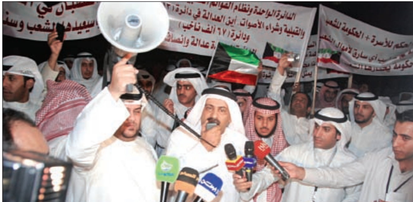
جانب من تجمع قوى شباب (16 سبتمبر) في ساحة البلدية أمس

سورية: ناشطون حقوقيون يتحدثون عن سقوط 33 قتيلًا.. و«سانا» تعلن سقوط قتيل واحد من حفظ النظام 31