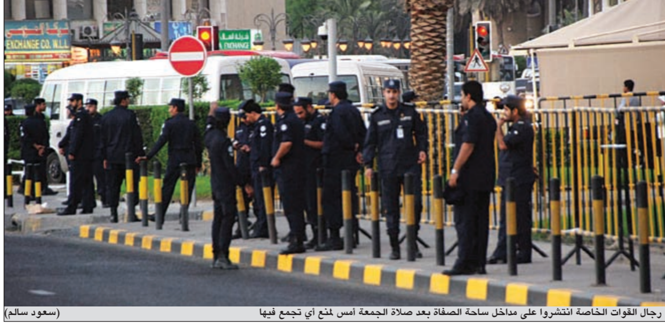
رجال القوات الخاصة انتشروا على مداخل ساحة الصفاة بعد صلاة الجمعة أمس لمنع أي تجمع فيها

بدأ بعدد قليل ثم تزايد إلى نحو 700 شخص وتناقص إلى 250 تقريبا، اتفق المتجمعون على الاعتصام الجمعة المقبلة لمواصلة التعبير عن مطالبهم، وفي هذا الإطار قال النائب مسلم البراك: «نعم حق شباب (16 سبتمبر) في الاعتصام بالمكان الذي اختاروه، كما تؤكد على كل المطالب التي تأتي وفق الدستور». من ثم اتجه المعتصمون بعكس اتجاه ساحة الصفاة مقبلين نحو برج التحرير وبمبنى محافظة العاصمة حيث حصل احتكاك بسيط بين بعض رجال الأمن وبعض المتجمهرين، الأمر الذي حدا بالشرطة بالدخول للتدخل وحث رجال الأمن على عدم الاحتكاك معهم والحفاظ على سلامتهم. وقبيل انقضاء التجمع الذي بدأ بعدد قليل ثم تزايد إلى نحو 700 شخص وتناقص إلى 250 تقريبا، اتفق المتجمعون على الاعتصام الجمعة المقبلة لمواصلة التعبير عن مطالبهم، وفي هذا الإطار قال النائب مسلم البراك: «نعم حق شباب (16 سبتمبر) في الاعتصام بالمكان الذي اختاروه، كما تؤكد على كل المطالب التي تأتي وفق الدستور». من ثم اتجه المعتصمون بعكس اتجاه ساحة الصفاة مقبلين نحو برج التحرير وبمبنى محافظة العاصمة حيث حصل احتكاك بسيط بين بعض رجال الأمن وبعض المتجمهرين، الأمر الذي حدا بالشرطة بالدخول للتدخل وحث رجال الأمن على عدم الاحتكاك معهم والحفاظ على سلامتهم. وقبيل انقضاء التجمع الذي