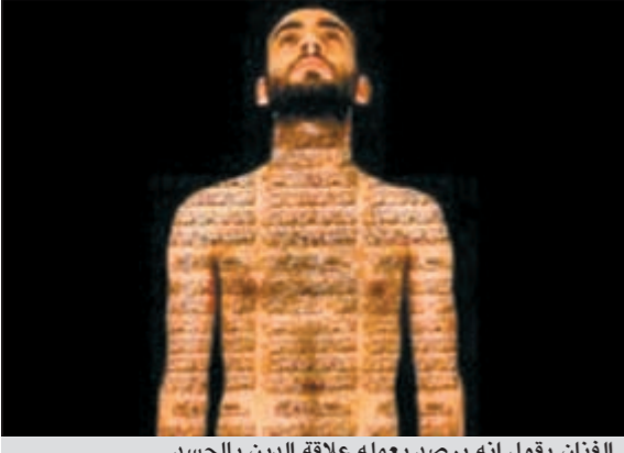
الفنان يقول إنه يرصد بعمله علاقة الدين بالجسد