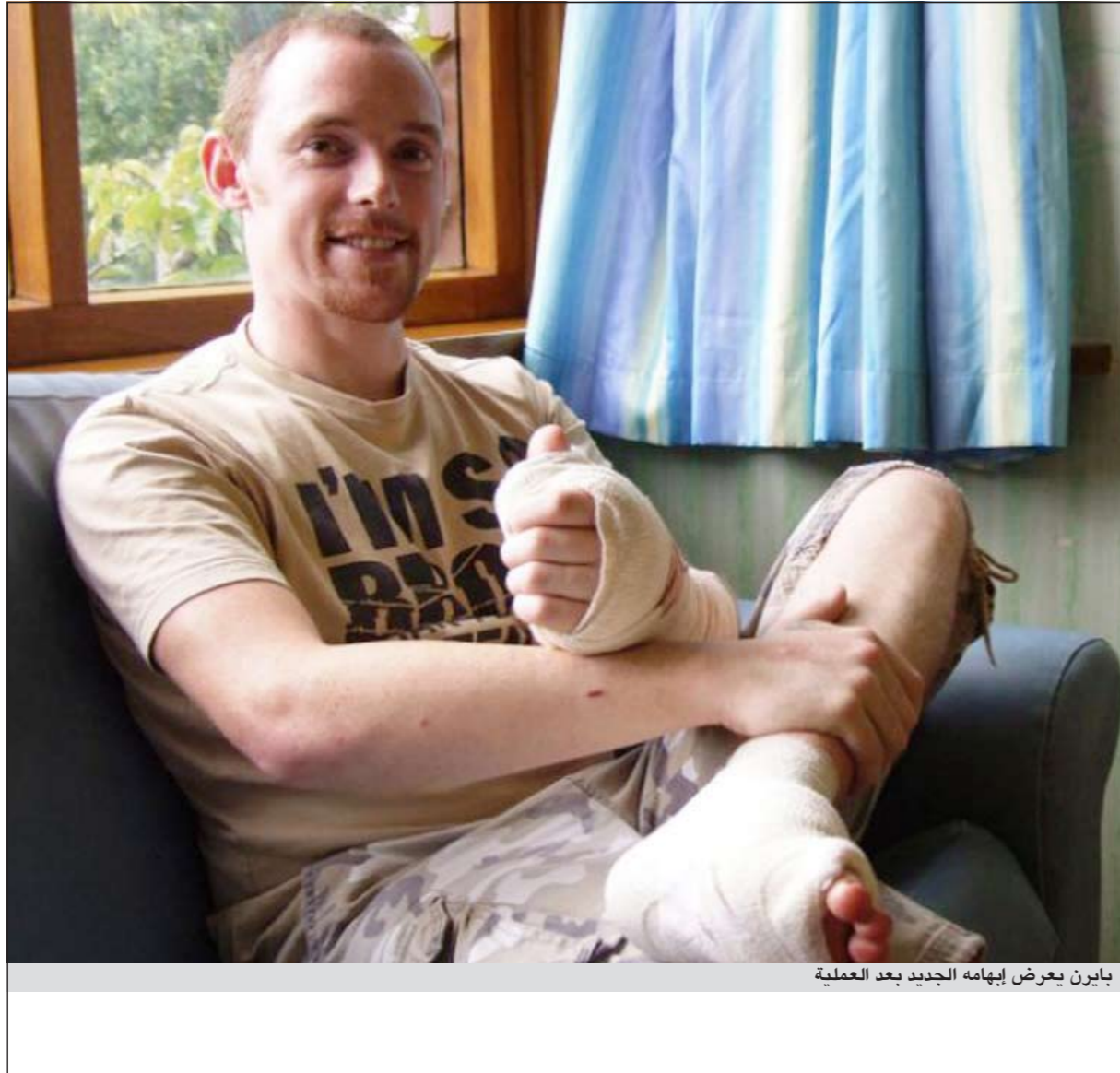
بايرن يعرض إبهامه الجديد بعد العملية