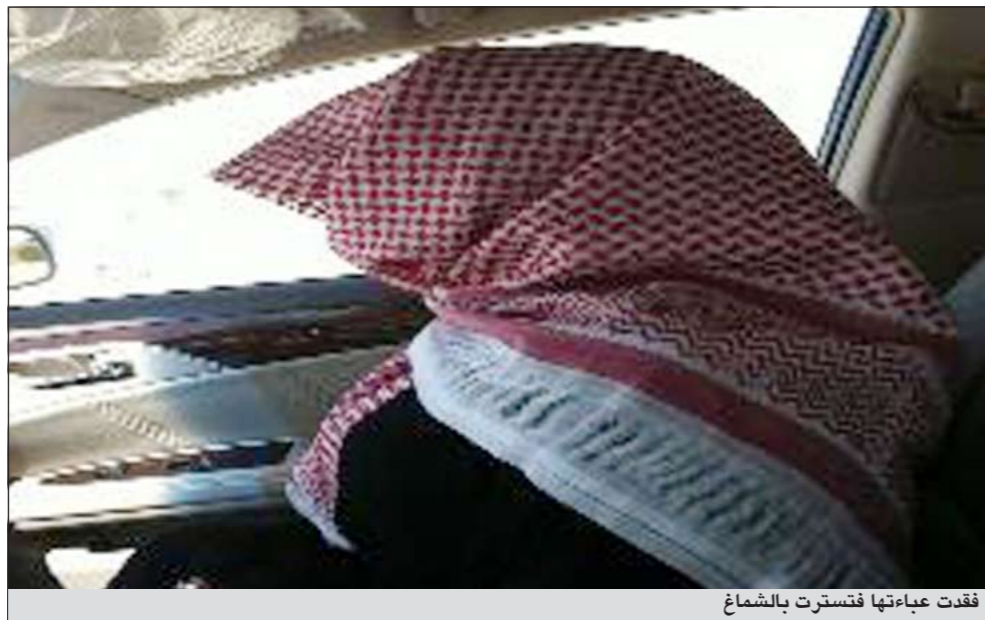
فقدت عباءتها فقتسرت بالشماغ

لإكمال الدراسة في أقسام العلوم والدراسات بالملز هذا العام، ولم تتعرض سابقا لأي موقف مشابه، ما جعلها تتجاهل تحذيرات إحدى صديقاتها من إمكانية تعرض عباءتها للسرقة. وبين ولي أمر الطالبة ان ابنته وضعت العبائة في الموقع المخصص للعباءات، ومع انتهاء الدوام لم تجدتها وفشلت في محاولات العثور عليها، ما يعني تعرضها للسرقة، مشيرا الى ان بعض الطالبات يتوافرن لديهن صناديق أماتات يضمن فيها العبائة، وهي الطريقة التي ستلجأ إليها ابنته خلال الأيام المقبلة للحفاظ على أغراضها من السرقة، وعدم تكرار مثل هذا الموقف المرحج.