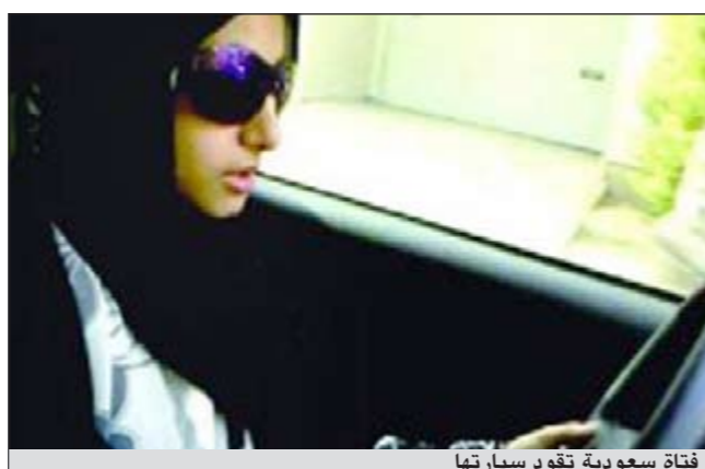
فتاة سعودية تقود سيارتها

خاصة بالعائلة، وفي منتصف الظهر عادت إلى منزلها من دون أن تتعرض للتوقيف أو المضايقات. وحرصت على عدم لفت انتباه السائقين المارة بعد أن ركبت العازل الحراري للسيارة بدرجات لا تسمح بتمييز الراكب منذ الوهلة الأولى، كما فضلت أن تقود بسرعات بطيئة، خصوصا أنها لم تتعلم القيادة إلا منذ شهرين، وفقا لصحيفة «الحياة» اللندنية الصادرة الأريياء الماضي. ولجأت والسدة الفتاة إلى تعليم ابنتها قيادة السيارة بعد أن ضاقت بها الحيل، ولم تعد تستطيع الاعتماد على السائق الذي يكلفها نحو 40 ألف ريال سنويا، من راتب شهري وإيجار سكن وسفر، كما أنها قررت عدم الاستعانة بسائقي سيارات الأجرة خوفا من حدوث مكروه لها أو لبناتها، خصوصا في ظل ظروف والدهم وعدم قدرته على القيادة موضحة أنها حاولت تعلم القيادة