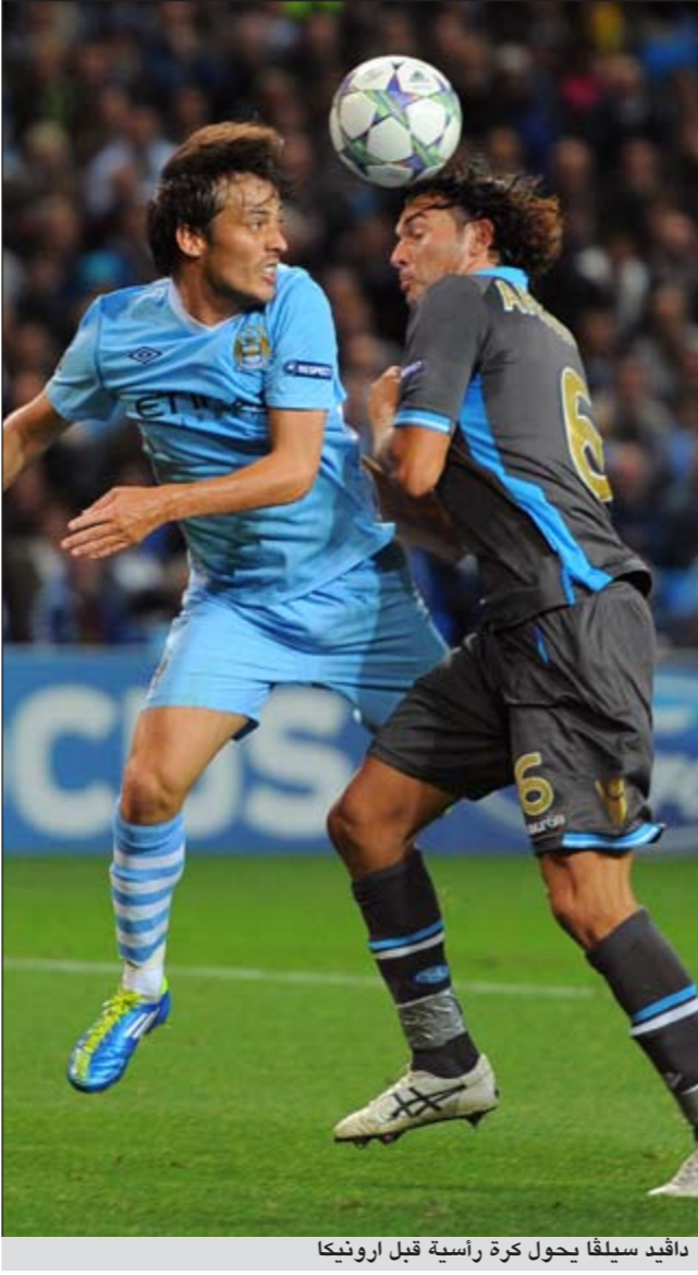
دافيد سيلفا يحول كرة رأسية قبل ارونيتكا

أكد اوندري سيلوستكا مدافع طرابزون سبور انه يعيش حلما جميلا بعدما سجل هدفا حاسما قاد به فريقه للفوز على مضيعة الإيطالي العملاق انتر ميلان. ووصف سيلوستكا شعوره بعد تسجيله هدف المباراة الوحيد بأنه «خيالي، قائلا: انني سعيد للغاية بفوزنا، لكن تسجيل الهدف كان اشبه بالحلم بالنسبة لي.