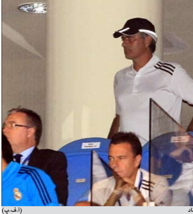
مورينيو الموقف تابع المباراة خارج الستاد

وفي المجموعة ذاتها وعلى ملعب «ال مادريغال»، استهل