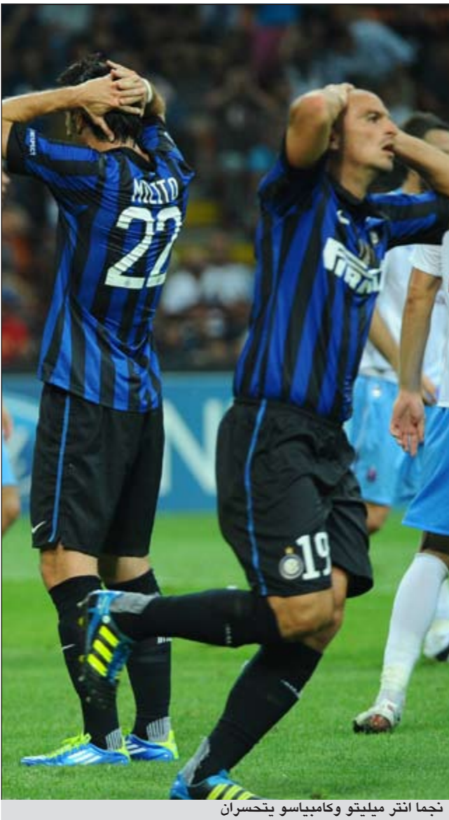
نجما انتر ميليتو وكامبياسو يتحسran

وبدا رونالدو غاضبا من الكلمات التي وجهها له لاعبو دينامو خلال المباراة والإصابة التي تعرض لها إضافة لصفارات وعبارات الاستهجان ضده، مشيرا إلى أن الجماهير تحقد عليه بسبب الثراء والوسامة والشهرة والتلق وليس هناك أي تفسير آخر.