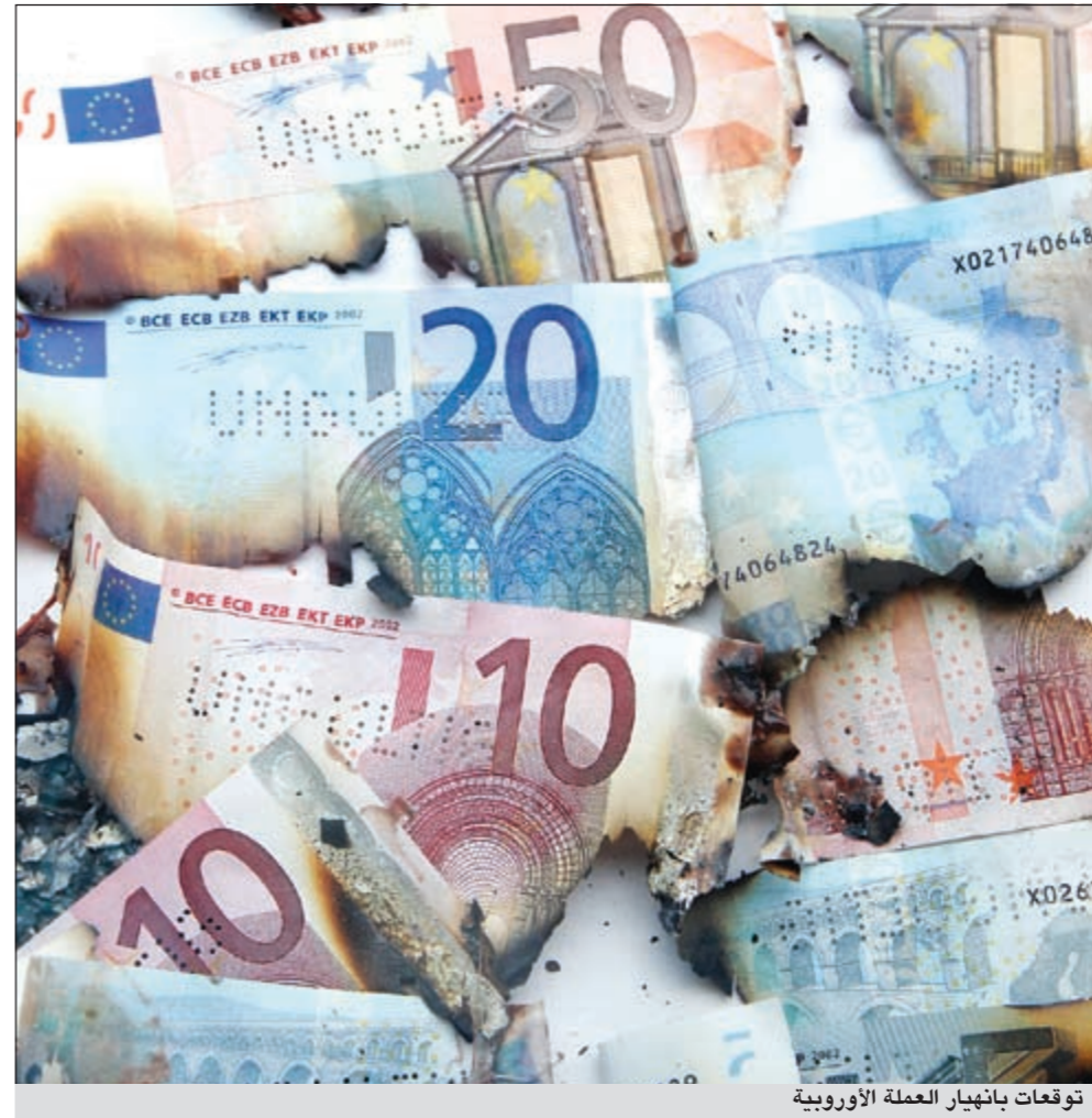
توقعات بانهايار العملة الأوروبية

أما باقي النتائج فستؤدي إلى حدوث تعثر كبير لأي من الدول، وإلى تكاليف محتمل أن تتحملها البنوك، التي ستخفف أسهمها حتى وإن تم إنقاذها بخطط إنقاذ في نهاية المطاف. وستتألف الفرص الاستثمارية من الشراء بعد حدوث شكل من أشكال التعثر أو أزمة أخرى.