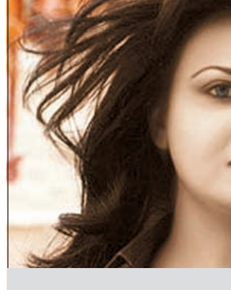
إيمان بن حسين

على خطى أفلام إيناس الدغدي المنيرة للجدل في مصر، قالت المخرجة التونسية إيمان بن حسين إنها لم تندم على طرح قضية زنى المحارم في تجربتها السينمائية الأولى «الضباب الأحمر». وأوضحت المخرجة، في تصريح لموقع mbc.net: «سأواصل فضح المسكوت عنه في مجتمعاتنا، ولا أحيذ تقديم قصص الحب النافثة، فهي موجودة في معظم الإنتاجات التجارية، وبالنسبة إلي، السينما رسالة هادئة».