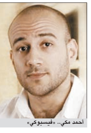
أحمد مكي.. «فيسبوكي»

حققت أغنية «فيسبوكي» التي قام بغنائها النجم الشاب أحمد مكي وطرحها يوم عيد الفطر مجموعة من الأرقام القياسية العالمية خلال فترة لم تتجاوز 10 أيام، حيث وصلت نسبة مشاهدة الأغنية على موقع «يوتيوب»، بحسب ما ذكر موقع «دنيا الوطن»، إلى مليون 589 ألف مشاهدة، مما جعل الأغنية تتصدر الموقع الثامن عالميا في قسم الموسيقى والـ 24 عالميا في نسبة المشاهدة. الجدير بالذكر ان مكي كان