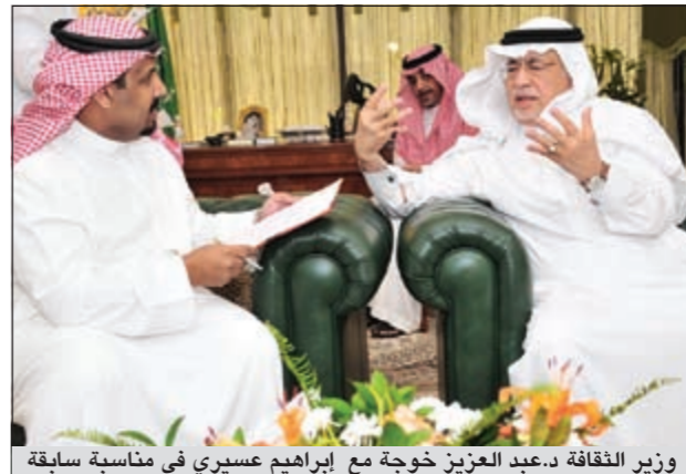
وزير الثقافة د.عبد العزيز خوجة مع إبراهيم عسيري في مناسبة سابقة

تقاضته، إلا أنها قالت إنه كبير. وكانت نجوى كرم وافقت مبلغاً لا يستهان به لقاء ذلك حملة دعائية لشركة عقارية لإحدى ماركات السيارات، وإن لم تصرح بالمبلغ الذي