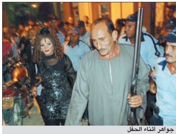
جواهر أثناء الحفل

اختارت الفنانة جواهر نوعا خاصا من الحراس يناسب ما تقدمه من أغنيات ذات لهجة مصرية نابغة من الريف والصعيد بالاستعانة بعدد من «الخفر» حاملي البندقية «أم زهرة»، خلال حفلها الخيري بالهرم سيتي وانتظروها في كواليس المسرح حتى الانتهاء من فقرتها الغنائية. حضر الحفل ما يقرب من نحو خمسة آلاف متفرج، وكان من بين فقرات الحفل فقرات غنائية للمطرب محمد كيلاي، بتظلم شركة «ليالي سكرين»، وبدأ الحفل بفقرة مميزة للدي جي مانو التي تنوعت بين عدد من الأغاني العربية والأجنبية والميكسات المميزة التي أعدها خصيصا للحفل.